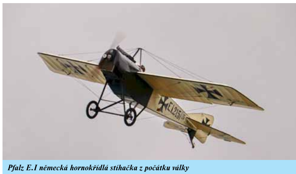
Pfalz E.I německá hornokřídla stíhačka z počátku války