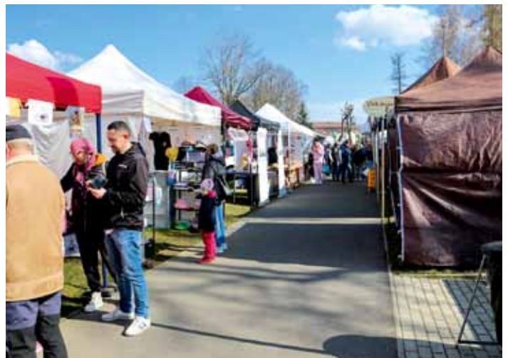
Josefský trh v Dolním Bousově - 21. březen 2026