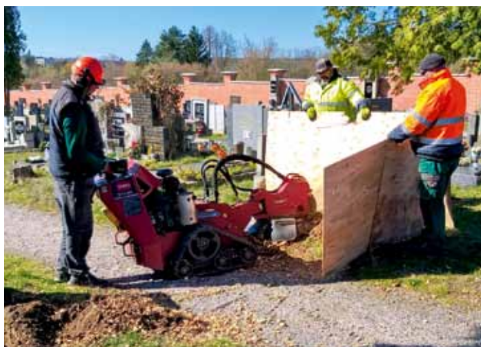
Na hřbitově bylo provedeno odfrézování starých pařezů