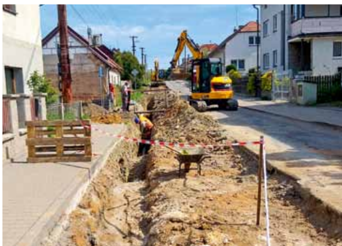
Začala rekonstrukce krajské komunikace ulice Lhotecká. Práce pokračují výměnou hl. vodovodního řádu – duben 2026