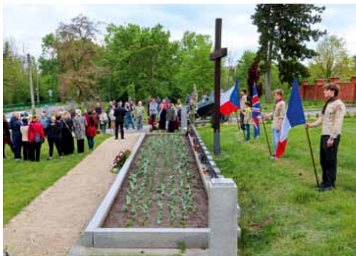
Pietní akt k 81. výročí ukončení II. světové války u pomníků padlých - 8. květen 2026