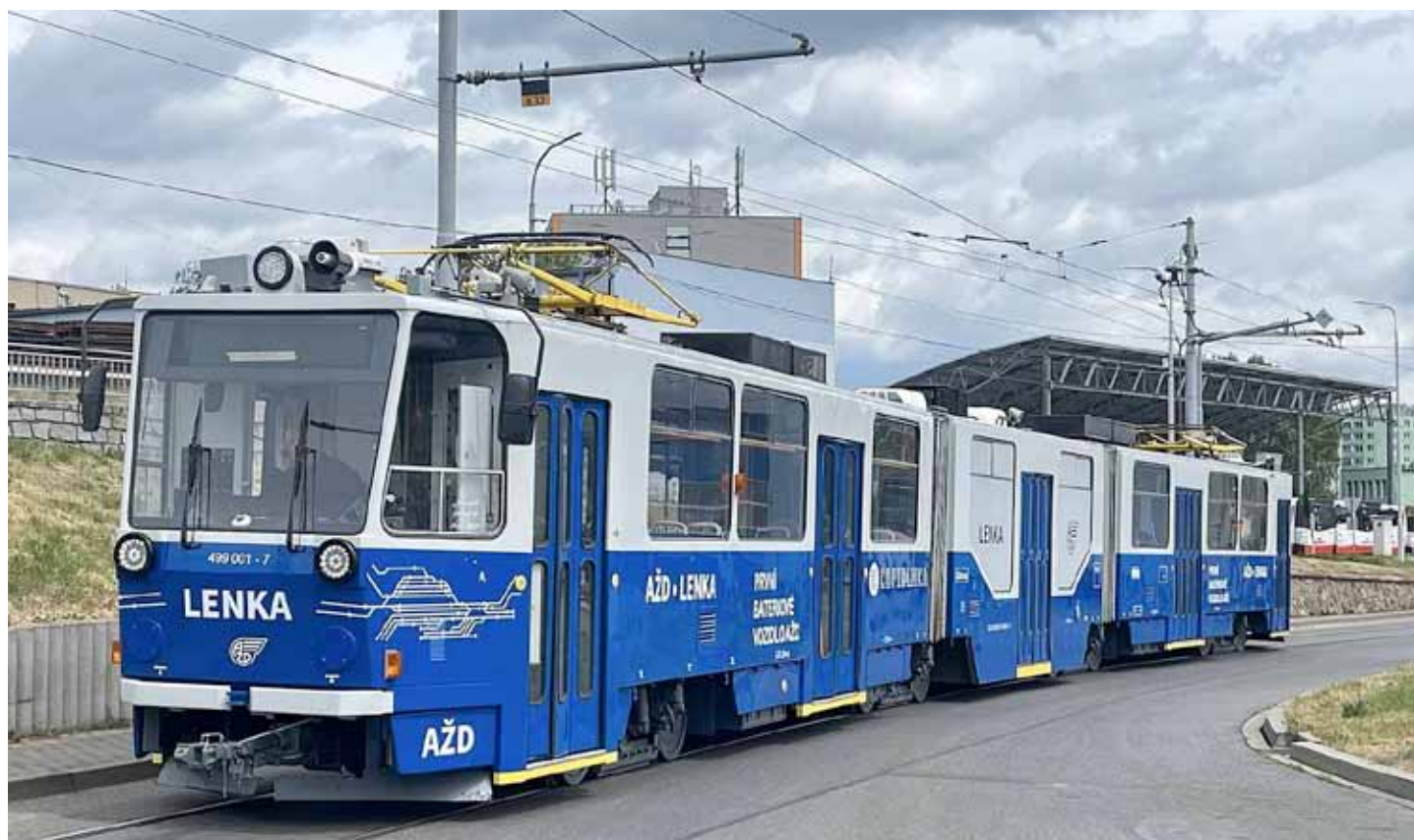
Zbrusu nová vlakotramvaj od společnosti AŽD Praha urazila cestu z Brna až na trať Kopidlno-Dolní Bousov.

Veškeré informace o provozu Kopidlanky cestující najdou na webových stránkách www.kopidlanka.cz .