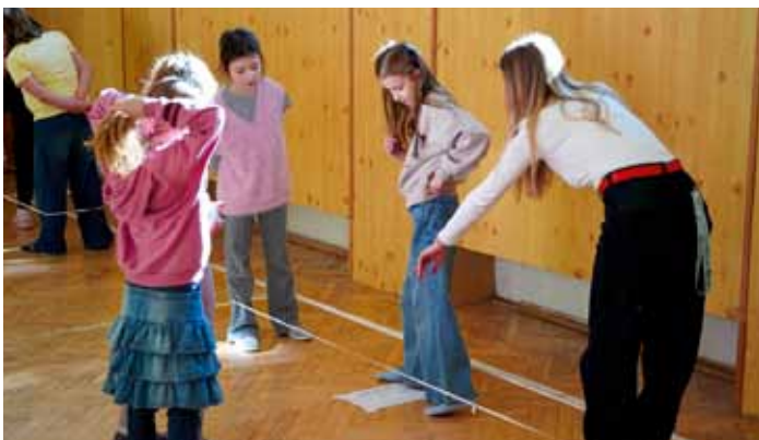
Den Offline na ZŠ - skákání gumy a výstava analogových přístrojů