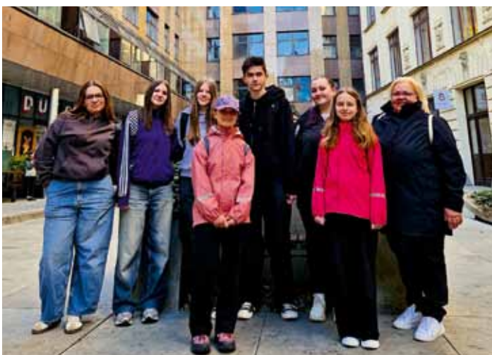
Redaktoři Školáka na vyhlášení výsledků soutěže Školní časopis roku 2026 (k článku na str. 17)