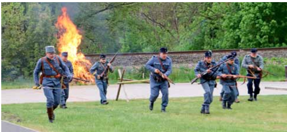
Vojenský den 2026 – ukázka simulace boje C.K. Rakouska a Carského Ruska

Něm. Wehrmacht – automobilová technika Steyer 1500A spolukonstruktor podvozku Ferdinand Porsche – výrobce Steyer Daimler Puch, některé díly vyráběla i Boleslavská Škodovka; a německý Mercedes Benz 1500 Mannschaftswagen pro přepravu 10 vojáků terénní verze.