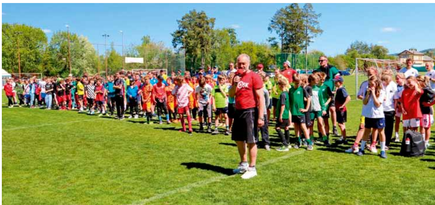
23. ročník fotbalového turnaje starších přípravků pod záštitou starosty města Dolní Bousov se konal 1. 5. 2026.