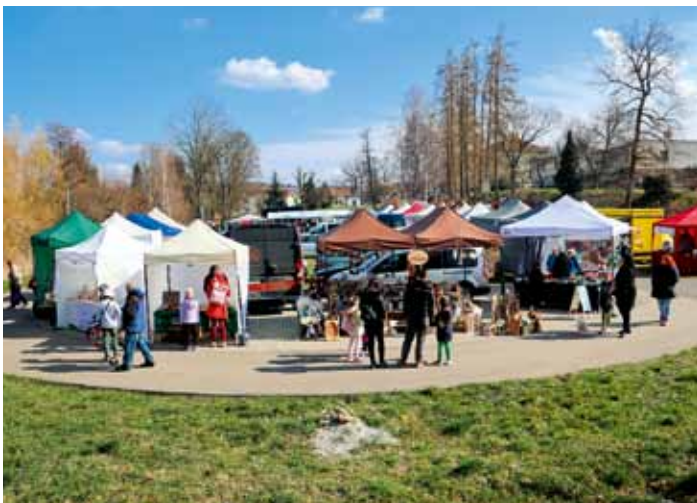
Josefský trh 2026 - areál V Břízkách