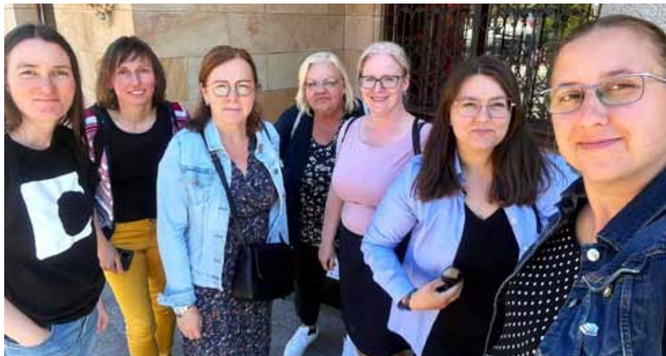
Čtenářský klub v galerii Lázně v Liberci

pro sebe místo, kde je mi právě teď dobře... O svých dojmech a pocitech jsme si pak povídaly u dobrého jídla a výborné kávy,