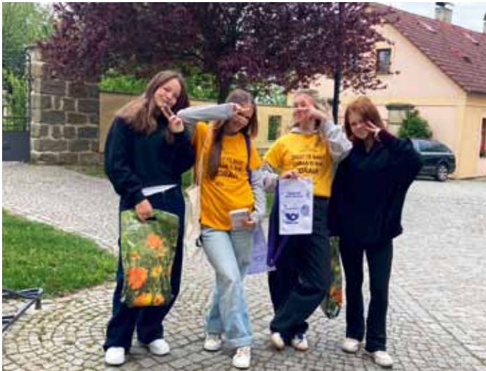
Ve středu 13. května uskutečnila sbírka Ligy proti rakovině. Díky dívkám ze ZŠ se do akce zapojil také Bousov.