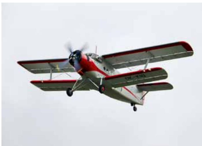
Vojenský den - letadlo AN-2 Antonov (k článku na str. 8)