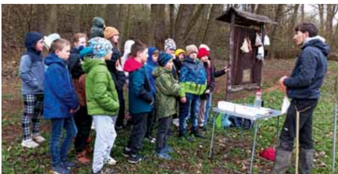
Přírodovědný kroužek - kroužkování na Bakovce 31. 3. 2026