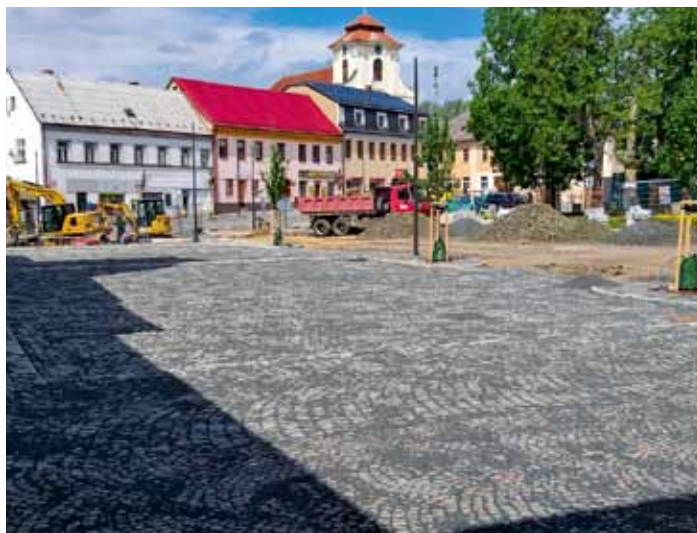
Rekonstrukce náměstí T.G.M. Končí další etapa prací, dláždění prostoru před radnicí s výsadbou stromů je dokončené – květen 2026