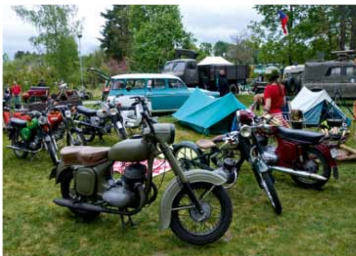
JAWISTI mládež spolek Rohatsko.