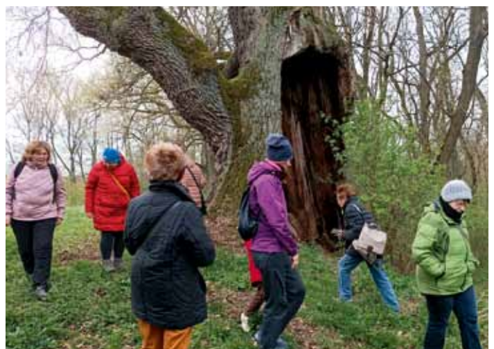
Akce místní komunity - výlet do Ujkovic k památnému dubu (k článku na str. 11)