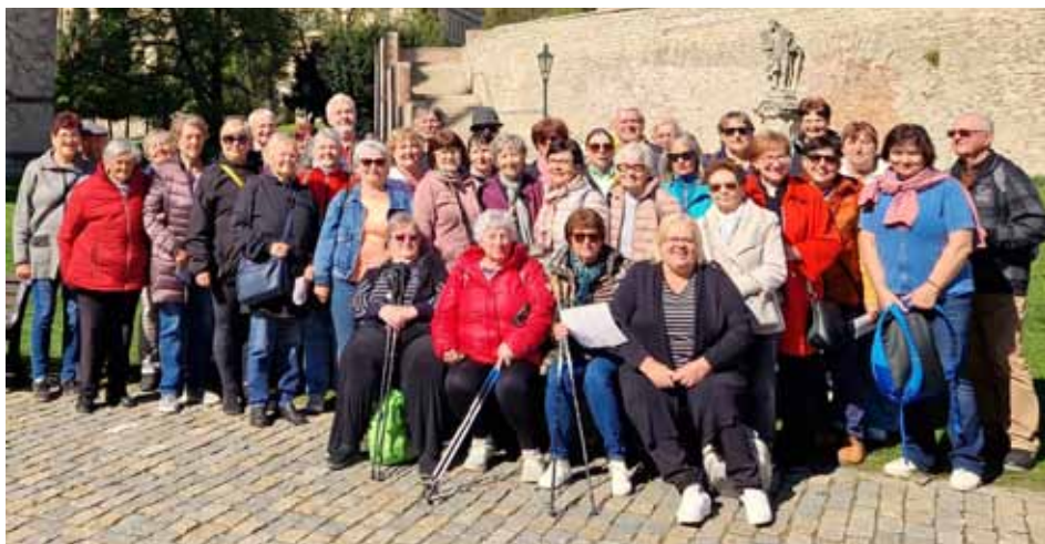
Účastníci zájezdu do Kutné Hory 24. dubna 2026

Před návštěvou chrámu jsme si udělali společně fotografie, někteří navštívili kapli Božího těla a také jsme využili vyhlídky nad kaplí, odkud je vidět velká část města, především budova jezuitské koleje, kterou