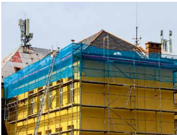
Další investiční akcí v Dolním Bousově je 1. etapa výměny střešní krytiny na ZŠ – duben 2026