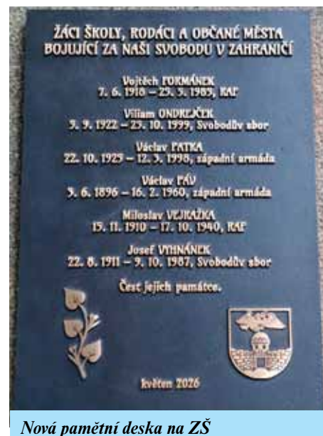
Nová pamětní deska na ZŠ