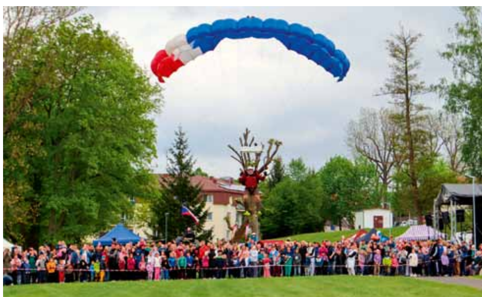
Seskok z historického letadla na vojenském dni provedli parašutisté Aeroklubu Jičín.