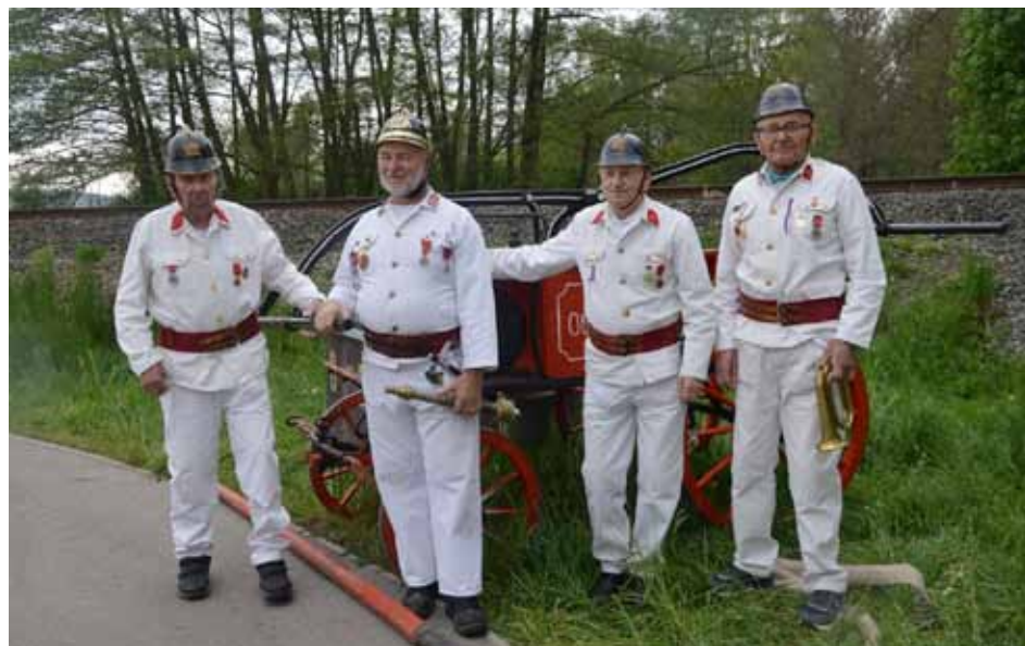
Hasiči Rohatsko se svojí ruční stříkačkou, kterou sami zrenovovali.

Během ukázky bylo možno vidět bombardování, letecké souboje a hojnou pyrotechniku. Doboví hasiči Rohatsko použili ruční stříkačku, kterou sami zrenovovali – předvedli hašení.