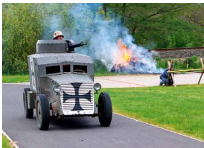
Vojenský den - obrněné vozidlo Romfell (k článku na str. 8)