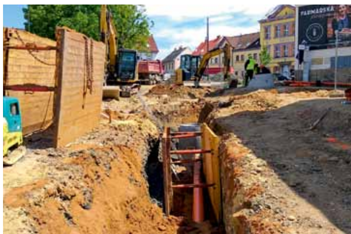
V ulici Brodecká, pod náměstím, se pracuje na novém napojení zbylých domů na stávající kanalizaci – květen 2026