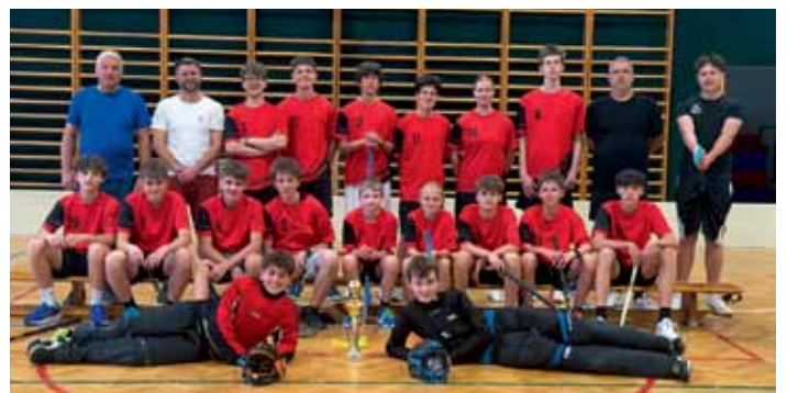
Florbalová liga volného času - starší žáci