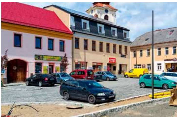
Rekonstrukce náměstí T.G.M. Prostor před obchodem Coop je prakticky dokončen a funguje v provizorním režimu – květen 2026