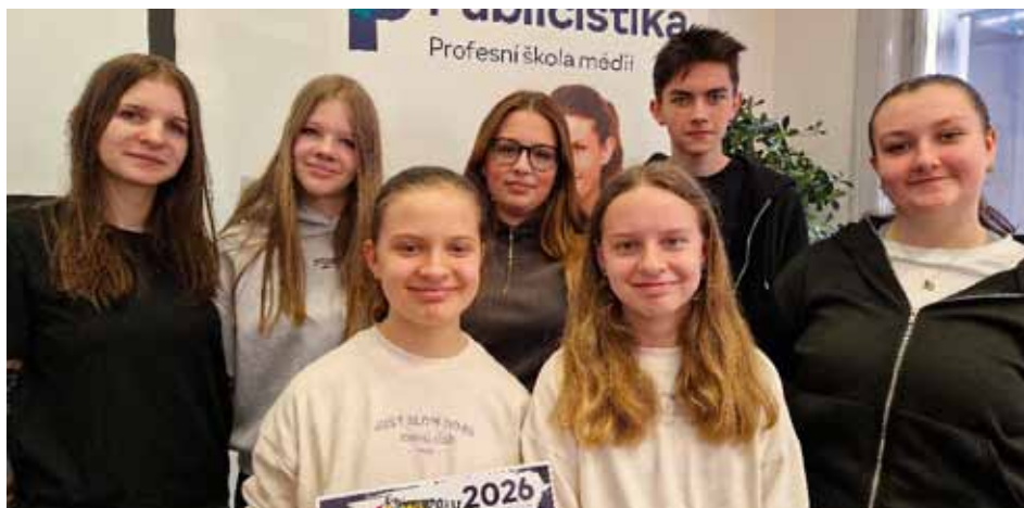
Redaktoři na vyhlášení výsledků soutěže Školní časopis roku 2026