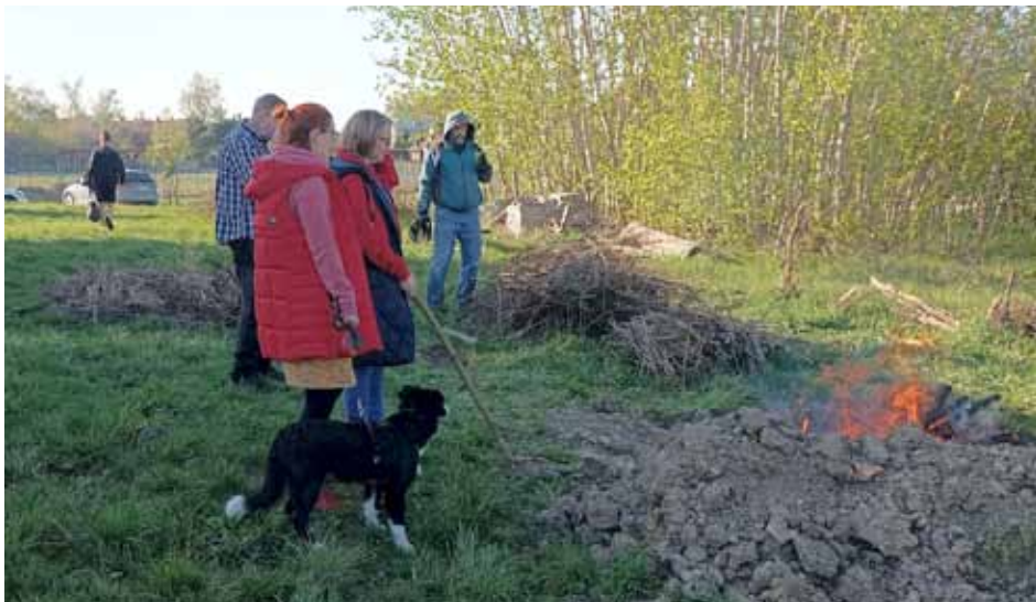
Biouhel už se tvoří 24. 4. 26

Pokračovali jsme na tvrziště porostlé hluchavkou nachovou, dymnivkami a orseji. Násep směrem k Pílskému rybníku je velmi vysoký a strmý. Na to, že tvrz zanikla v polovině šestnáctého století, je místo