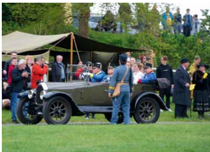
Vojenský den - historická rekonstrukce ukázky „Tak nám zabili Ferdinanda“. (k článku na str. 8)