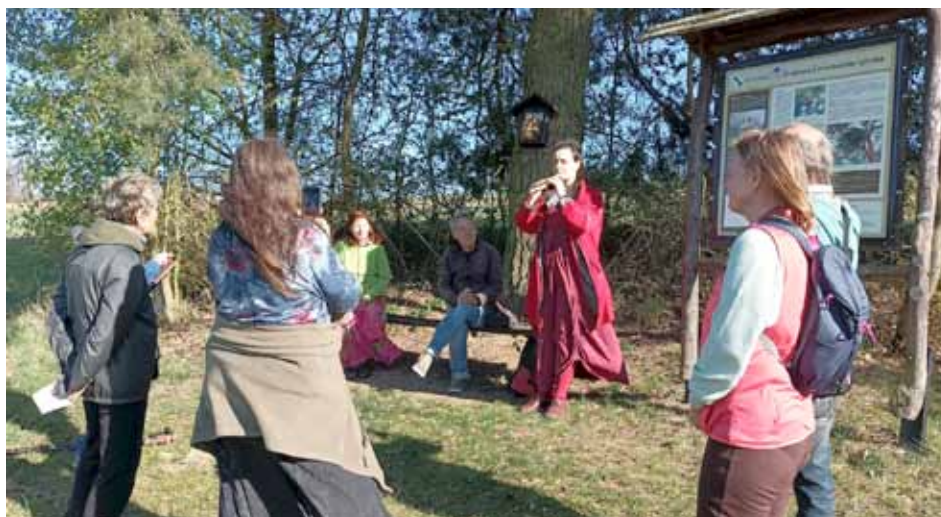
Ve čtvrtek 23. dubna se konala poetická procházka po naučné stezce