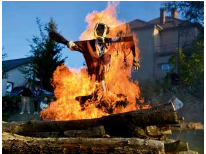
Čarodějnice 2026 v areálu V Břízkách - 30. duben 2026