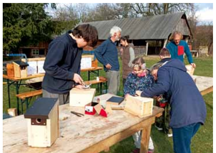
Výroba patčích budek na Rachvalách