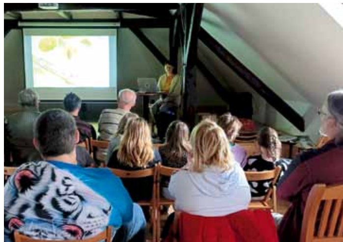
Foto z přednášky Zázrak jménem les