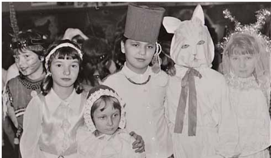
Karneval v nové hospodě na Svobodíně, konec 80. let