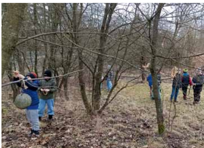
Děti z přír. kroužku rozvěšují věnečky s krmením ptákům