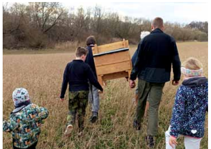
Cestou k Podlesáku s budkou pro dudka