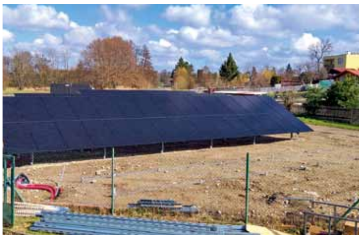
Pokračuje stavba fotovoltaických panelů u ČOV - březen 2026