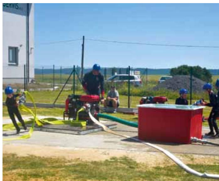
Fotografie z činnosti SDH Dolní Bousov v r. 2025