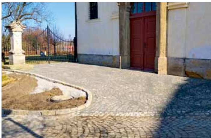
Kostel sv. Kateřiny má nově vydlážděný vstup ze západní strany