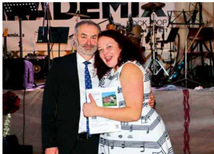
Ples města - šťastná výherkyně poukazu do hotelu v Karpaczi