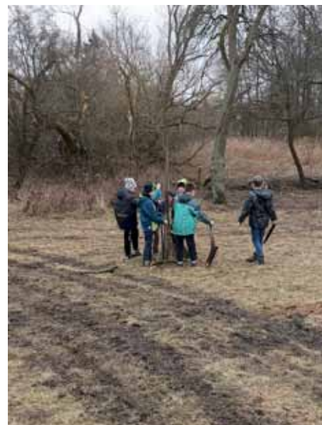
Kluci se snaží zachránit stromek