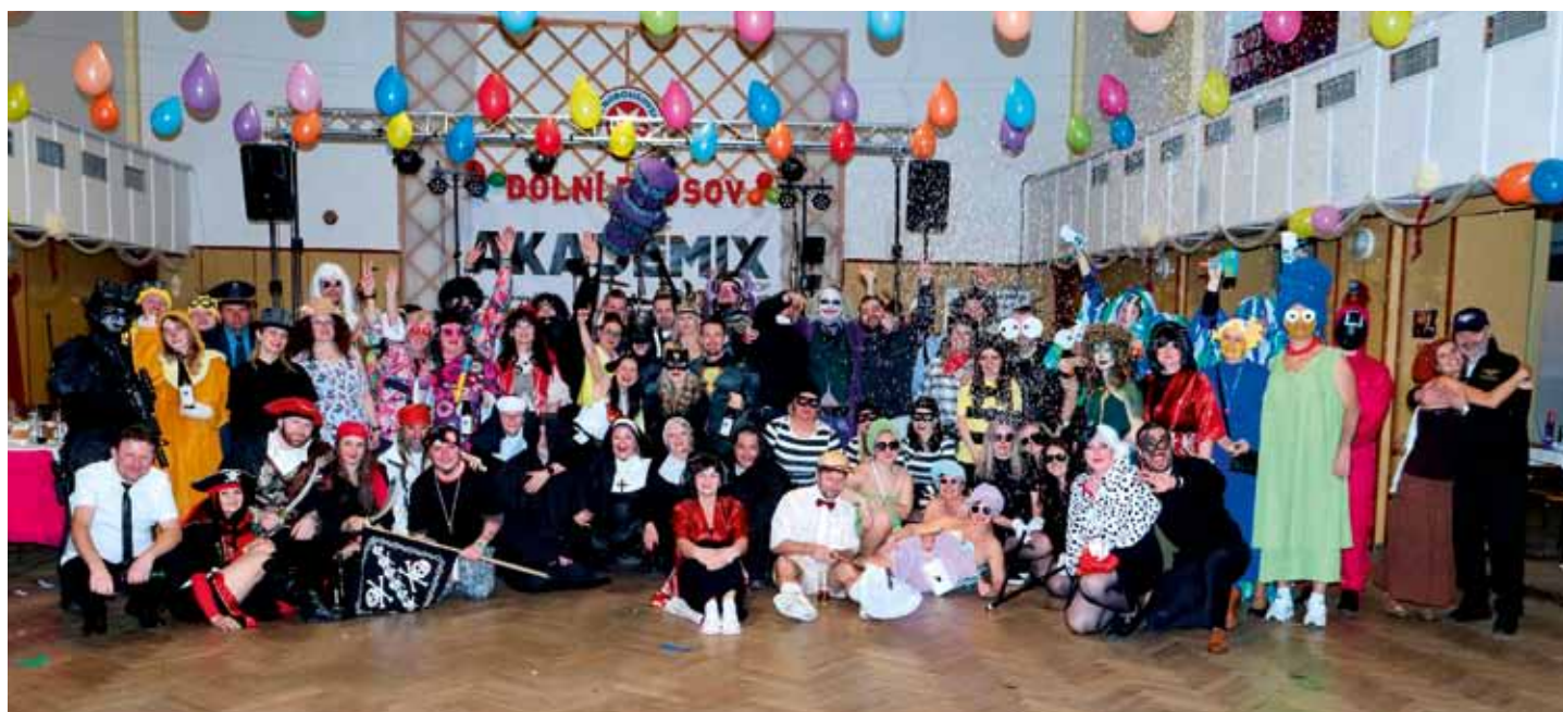
Na Karnevalu Dolnobousovského SK bývá spousta krásných masek, což z něho dělá velmi oblíbenou událost regionu 7. března 2026