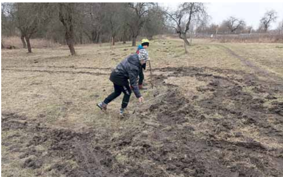
V bývalém Hellerově sadu někdo zřejmě čtyřkolkou zničil dva vysazené stromky