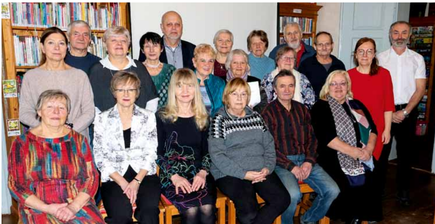
Slavnostní zakončení 2. semestru Univerzity třetího věku - 2. únor 2026 knihovna D.B.