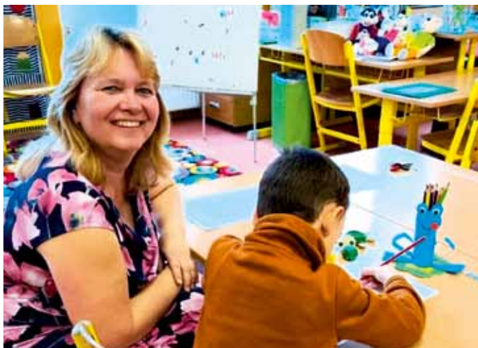
K zápisu bylo letos přihlášeno celkem 66 dětí