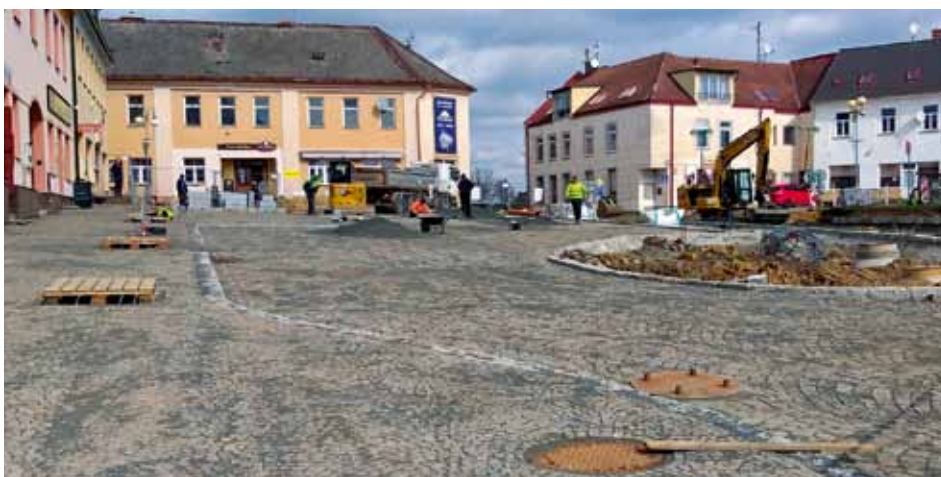
Rekonstrukce náměstí TGM – finišuje pokládka dlažebních kostek na západní straně