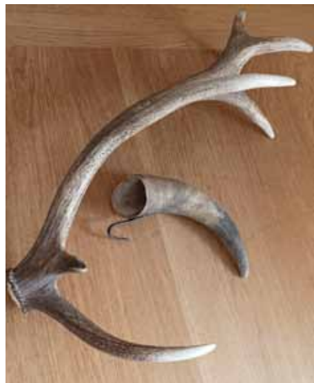
Rozdíl mezi rohem a parohem