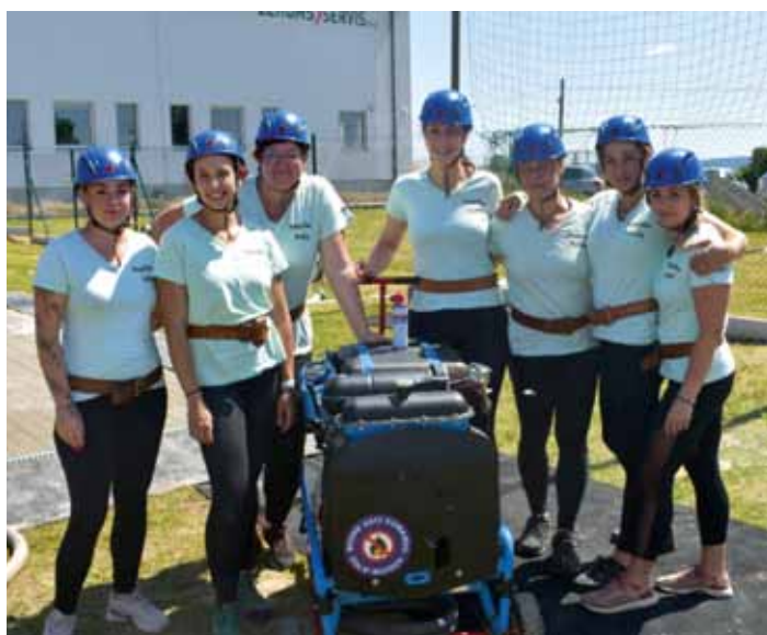
Fotografie z činnosti SDH Dolní Bousov v r. 2025