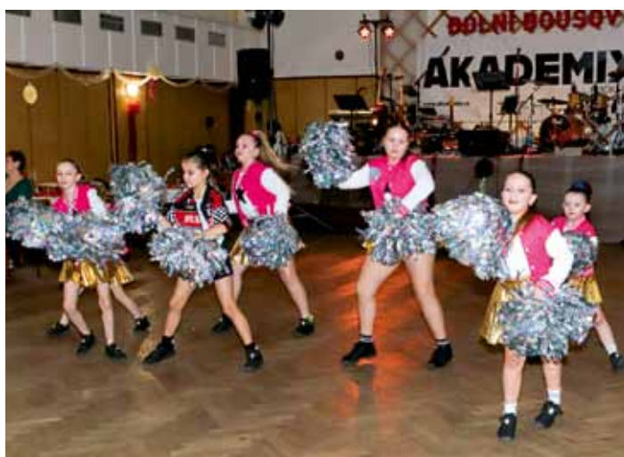
Ples města - taneční skupina HoPe Club Bakov nad Jizerou