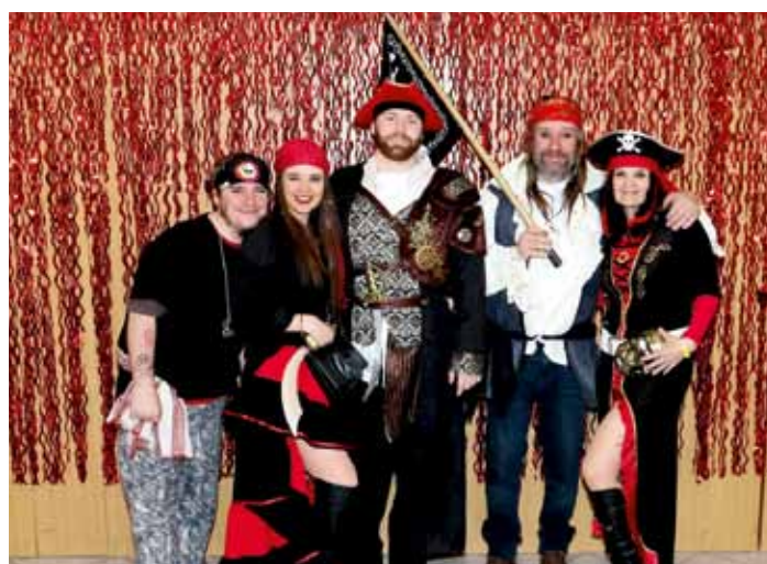
Karneval Dolnobousovského SK - 2026