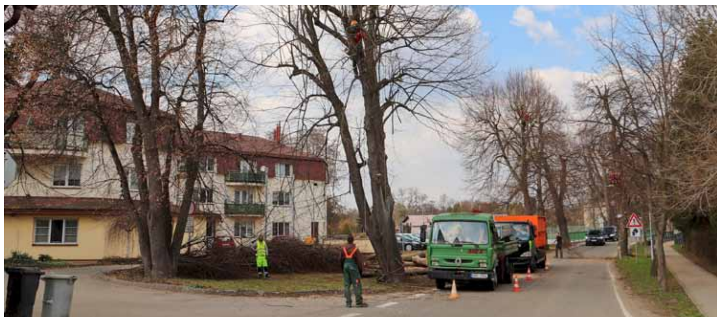
Zdravotní prořez lípové aleje v ulici V Lipkách byl svěřen odborné firmě