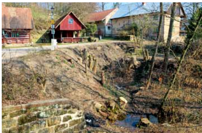
Střehom - vyřezání náletových dřevin za mostkem rybníka Komorník