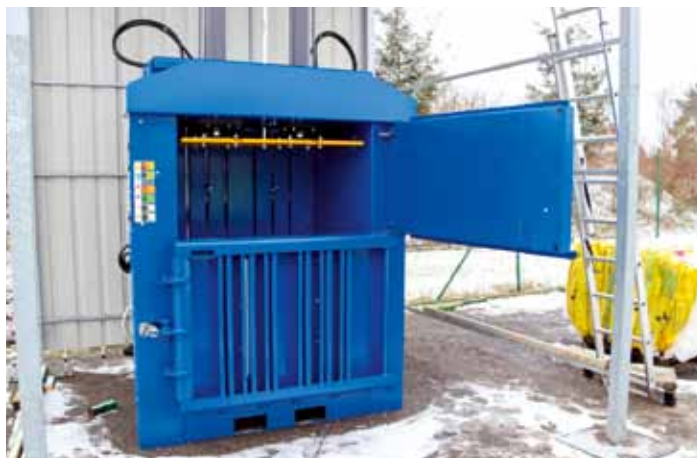
Město na sběrný dvůr pořídilo paketovací lis MACFAB COMPACT