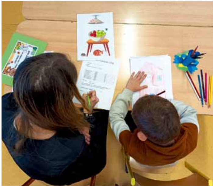
Brány školy se otevřely budoucím prvňáčkům