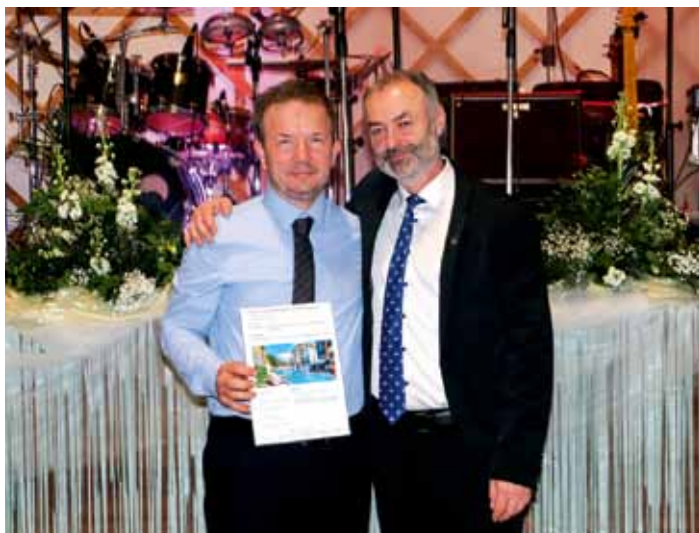
13. Ples města - starosta předal šťastnému výherci hlavní cenu. Víkendový pobyt v polských Krkonoších