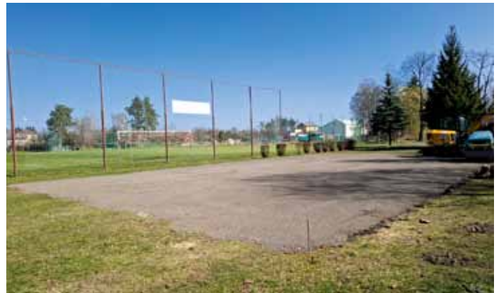
Zpevněná plocha pro vybudování skateparku