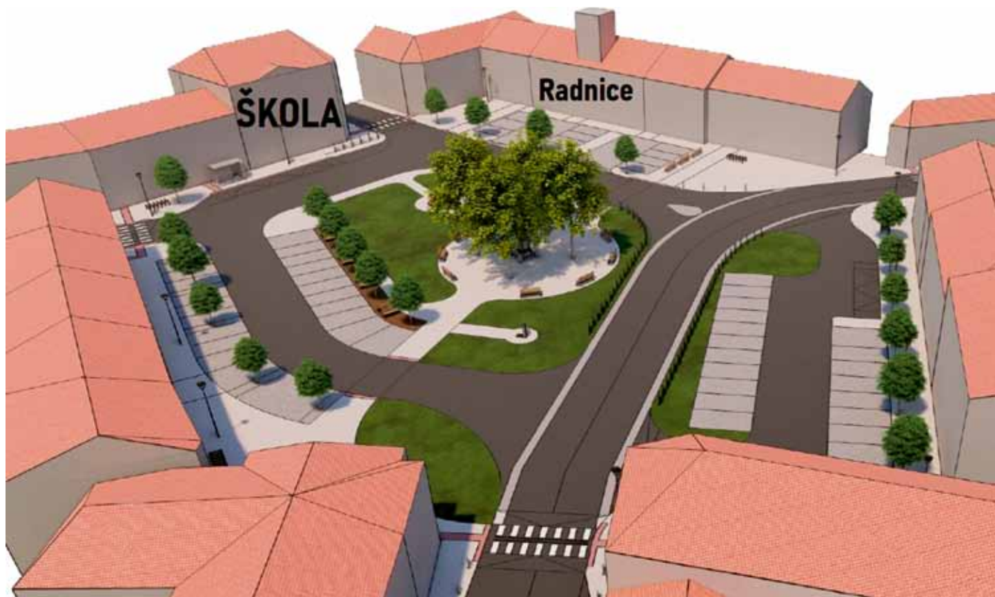
V tomto případě je naznačen pohled při příjezdu od Sobotky Palackého ulicí.