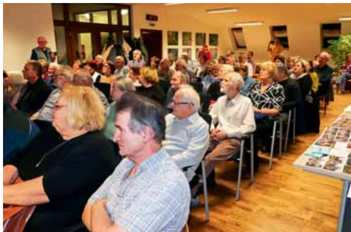
Zaplněná zasedací síň městského úřadu při slavnostním křtu knih s tématem Dolnobousovska - 30. leden 2025