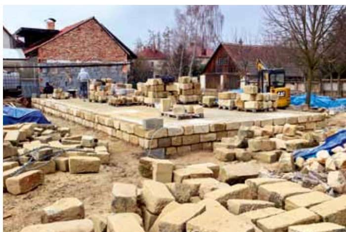
V posledním únorovém týdnu, za příznivého počasí, začala stavba vekovního pódia za Infocentrem v Dolním Bousově