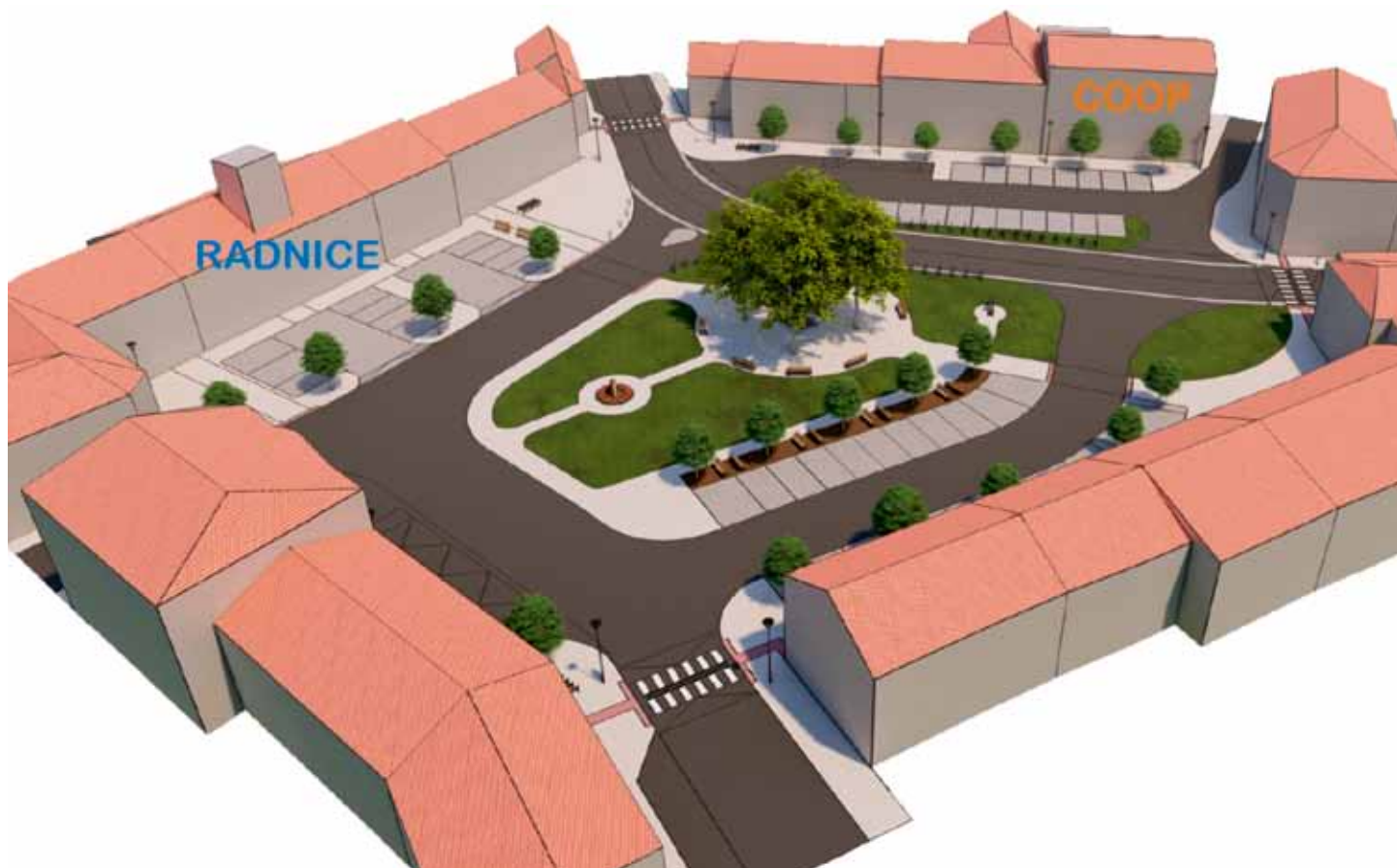
Vizualizace nové podoby náměstí T. G. Masaryka - pohled od Dlouhé ulice.