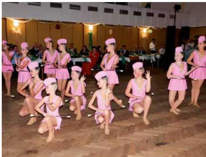
13. Ples města - vystoupení mažoretek Kopretiny z Dobrovice.