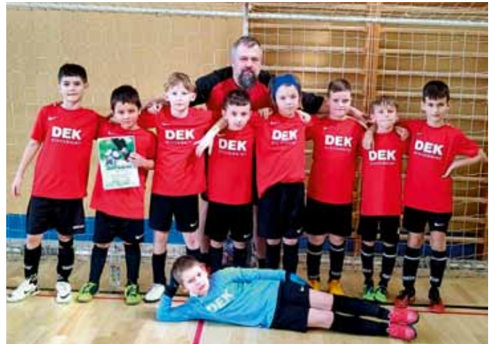
Přípravka DBSK "U9" dne 15. 3. na halovém turnaji v Lomnici nad Popelkou