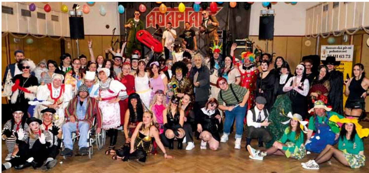
Karneval Dolnobousovského SK - 1. březen 2025