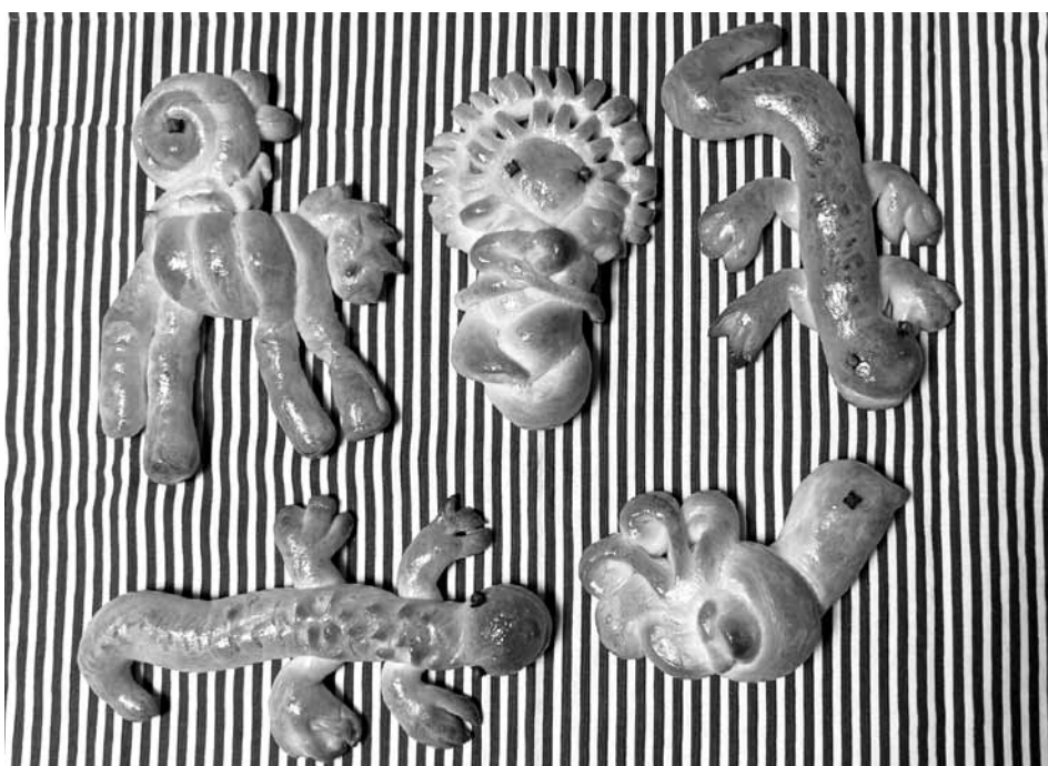
Ukázky hotových figurek

ho z nejstarších římských bohů, Jana. Janus byl bohem dveří, vrat, vchodů, začátků a konců. Pro začínající rok bychom nenašli vhodnějšího.