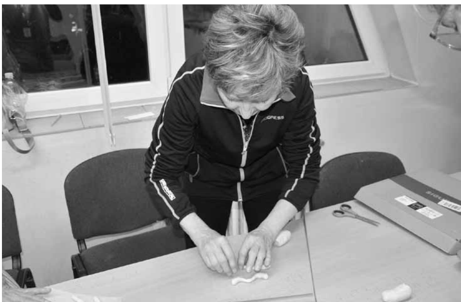
Pečení figurek z kynutého těsta v DB

Dostali jsme se také k významu názvů prvních měsíců v roce. „Leden“ je česky významově více než jasný. Okolní země se drží římského názvu január, podle jedno-