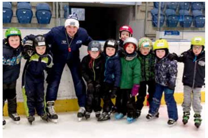
Naši prvňáčci se letos zúčastnili desetidílného kurzu bruslení. Pod vedením zkušených trenérů se učili správnou techniku bruslení a udržení rovnováhy.