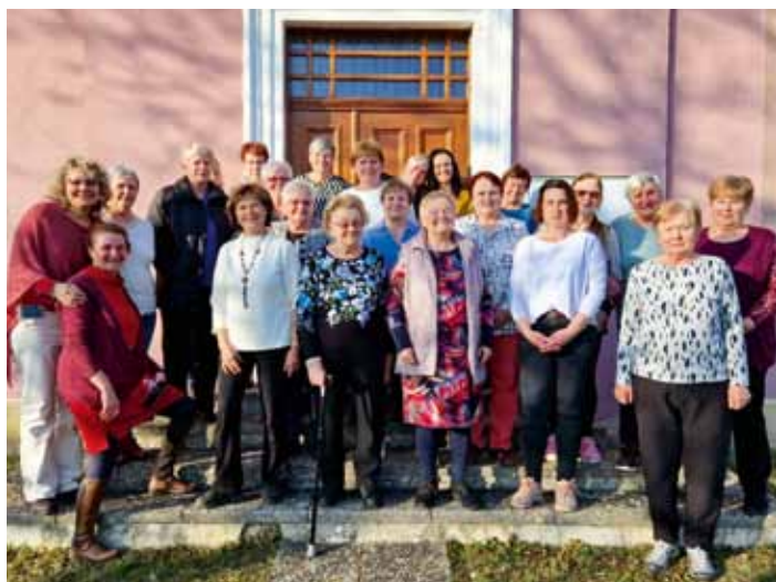
Jarní setkání, Bechov, 8. 3. 2025