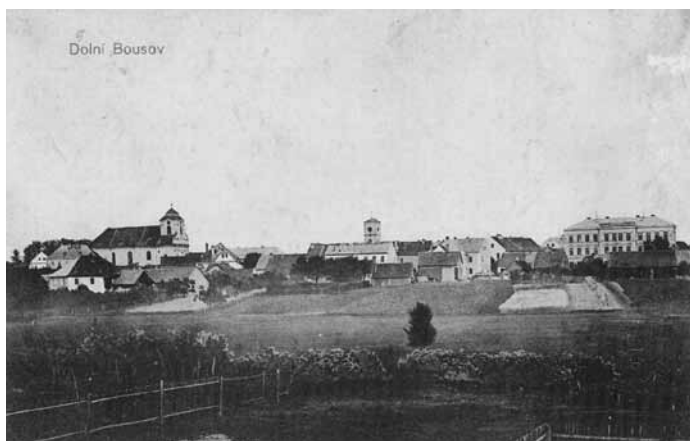
Pohled na louku, která zbyla po rybníku Brodek