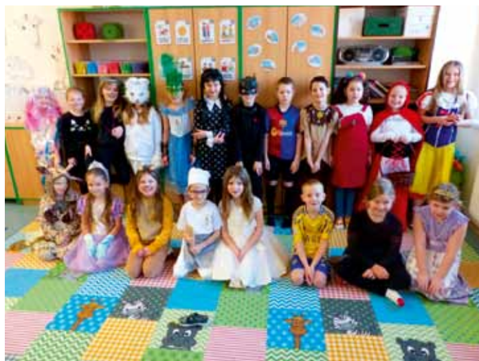
Karnevalový rej žáků 1.-3. tříd v základní škole