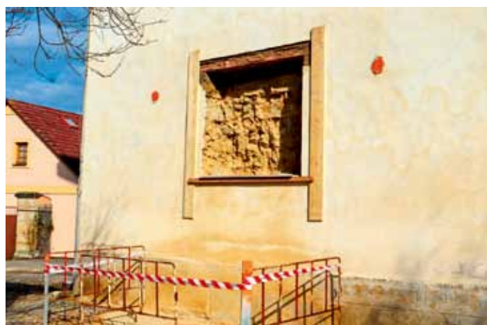
Při přestavbě západní části kostela vzniká nové okno. Objevila se struktura materiálu z čeho byl kostel sv. Kateřiny postaven.