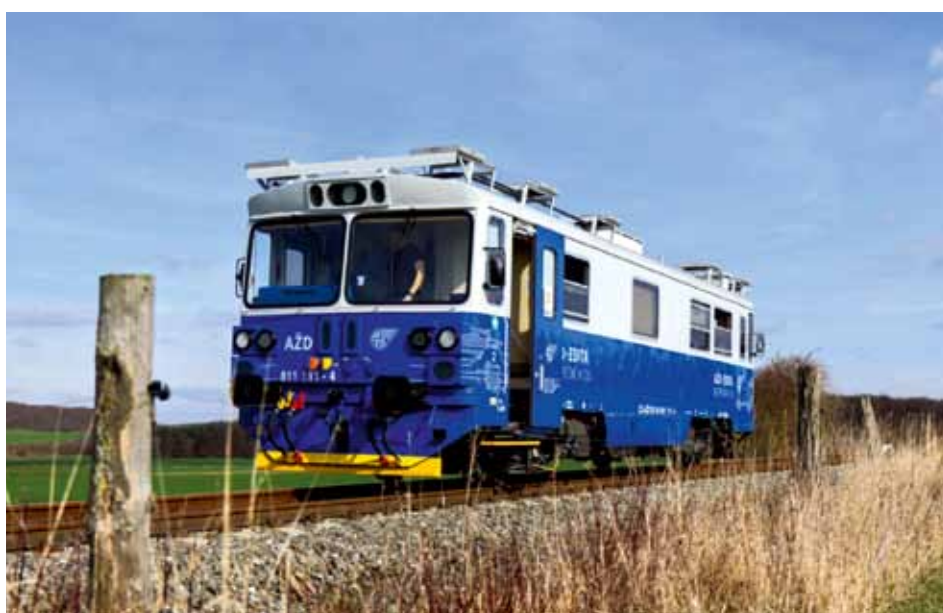
EDITA - modernizovaný motorový vlak, který řídí sám sebe.