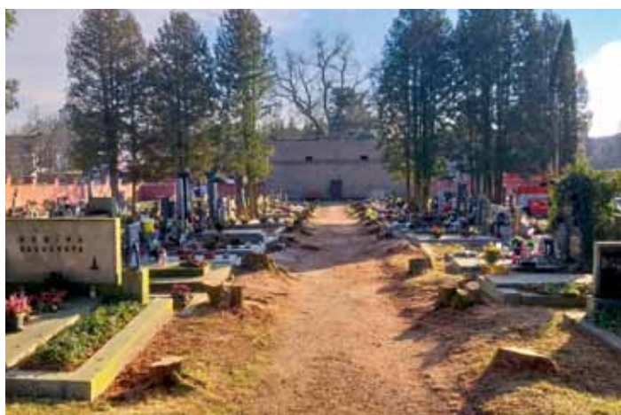
Na hřbitově v D. Bousově došlo k vykácení zeravů z bezpečnostních důvodů a z rizika poškození náhrobků - únor 2025