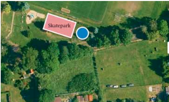
Návrh umístění skateparku a posun workoutového cvičiště