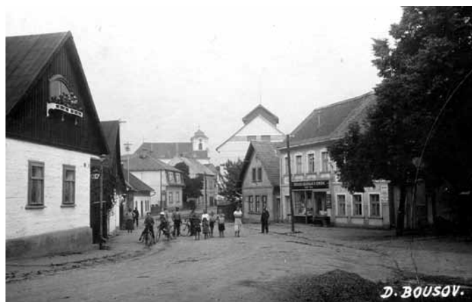
Pohled do Brodecké ulice od křižovatky u zrcadla