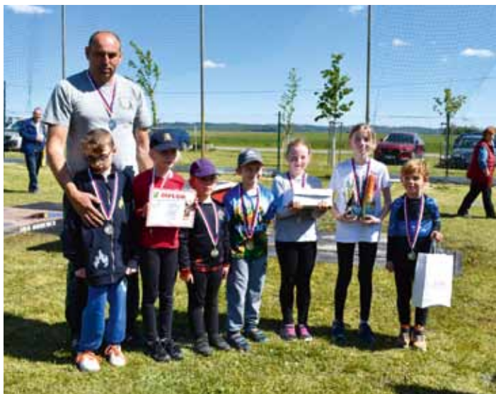
Kroužek mladých hasičů při SDH Dolní Bousov se v roce 2024 zúčastnil mnoha soutěží