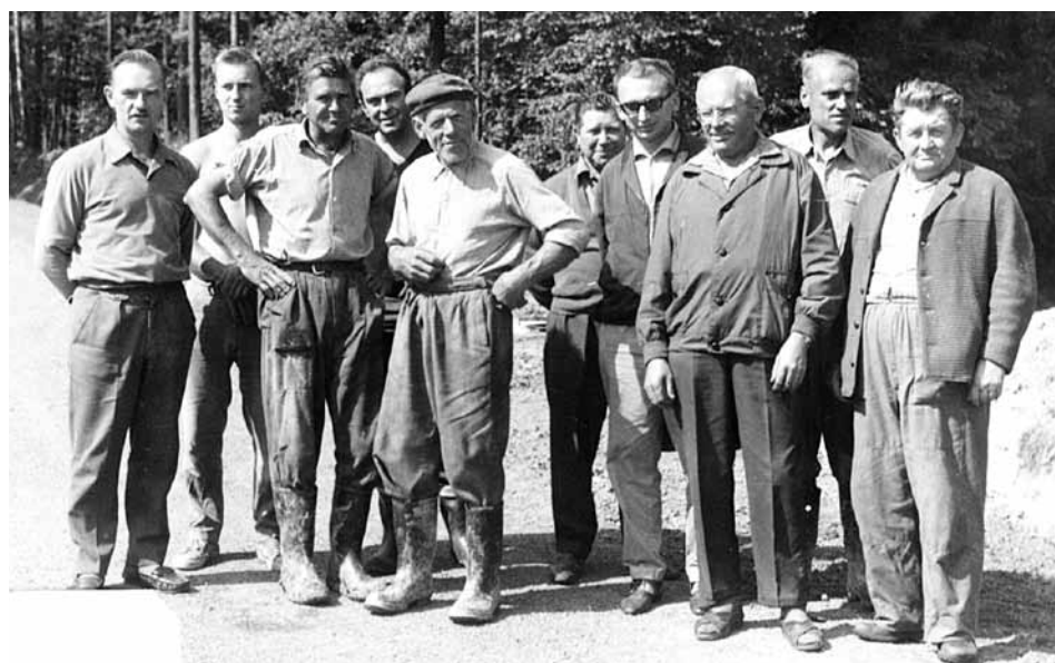
Nová asfaltová cesta na Svobodín, 1968 - brigádníci

ONV k jednání se Státním statkem v Mnichově Hradišti o převodu JZD do Státních statků. Tento návrh byl 15. července na členské schůzi většinou hlasů schválen, jelikož jiné východisko nebylo. A tak i na farmě Bechov došlo 15. září k podpisování darovacích listin zemědělské půdy československému státu, zatím jen od členů JZD, a stanoveno, že Statky začnou na převzaté půdě hospodařit od 1. ledna 1967.“