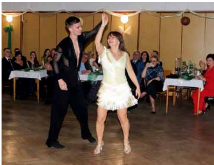
13. Ples města