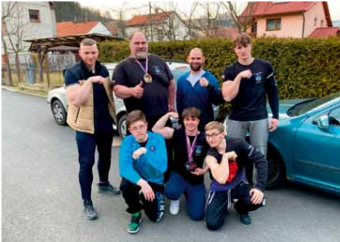
Členové AWK Dolní Bousov se zúčastnili Mistrovství České republiky v armwrestlingu v Životicích u Nového Jičína.