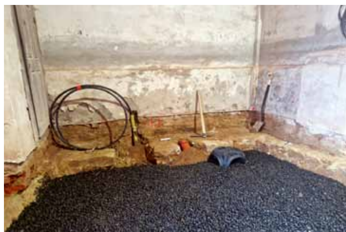
V kostele byly zřízeny přípojky vody a kanalizace, kompletní vnitřní rozvody a položena nová skladba podlahy.