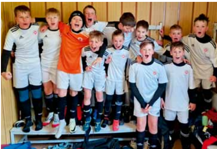
Mladší žáci "U13" sehráli 23. 3. 2025 mistrovské utkání I.A třídy (SK Komsonosy "B" - DBSK 0:1)