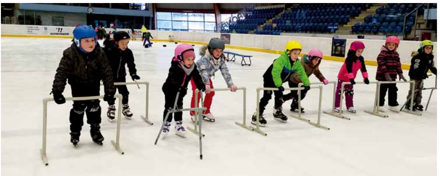
Na začátku kurzu někteří bojovali s prvními krůčky na bruslích. Na konci kurzu již zvládli i jednoduché otočky či slalom mezi kužely.