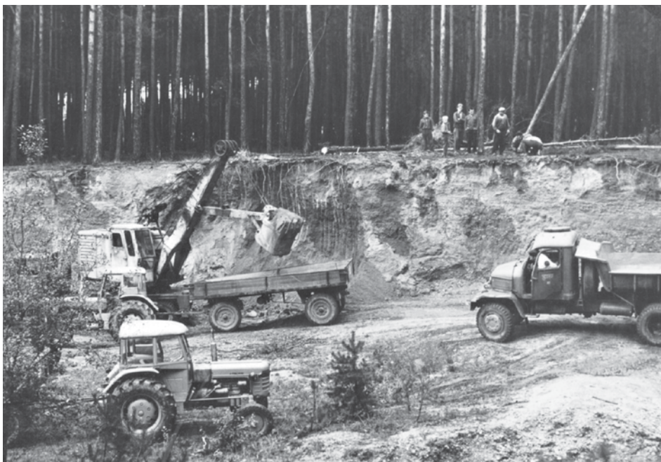
Těžba písku v lese nad Bechovem, 60. léta

V roce 1968 došlo k rekonstrukci lesní cesty – Formanky, jež prováděly státní lesy. Při té příležitosti byl položen asfaltový povrch cesty z Bechova k zastávce na Svobodíně. Náklady činily 187 000 Kčs.