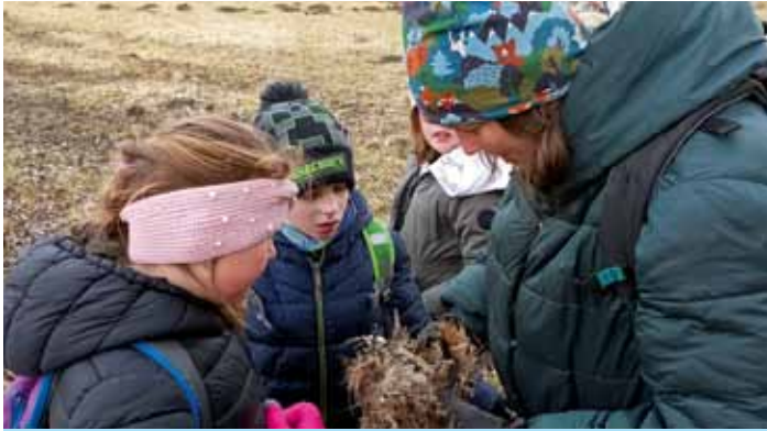
Přír. kroužek - při čistění budek se najde spousta zajímavých věcí