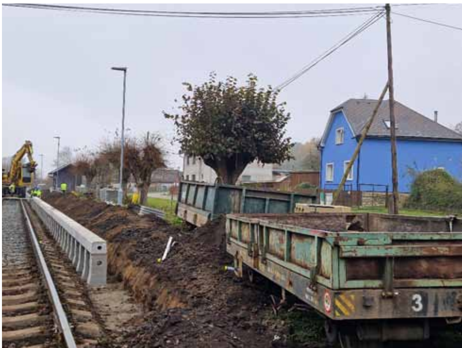
Pohled na železniční zastávku na Bechově v r. 2024