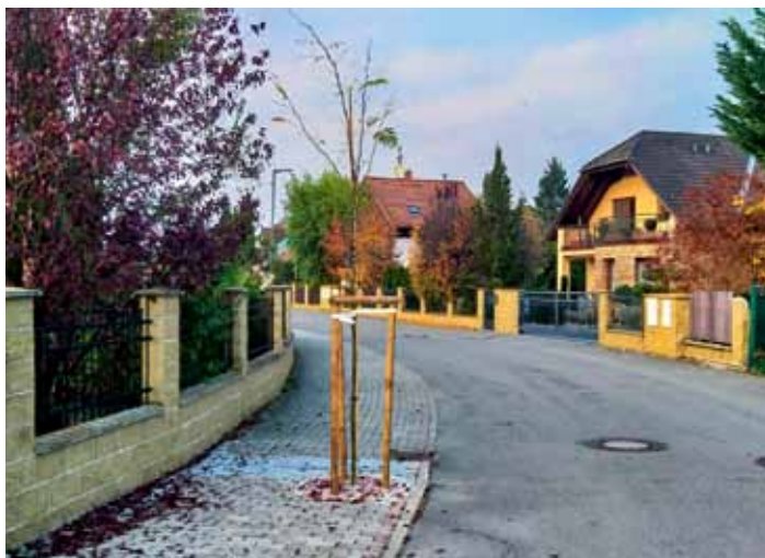
Po opravě chodníku v Akátové ulici se postupně vysazují nové stromky