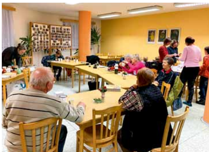
V pondělí 11. listopadu proběhlo v jídelně Domu s pečovatelskou službou degustační setkání, kdy předmětem ochutnávání byly dary zahrady a bylinky. Akci pořádala MAS Český ráj.