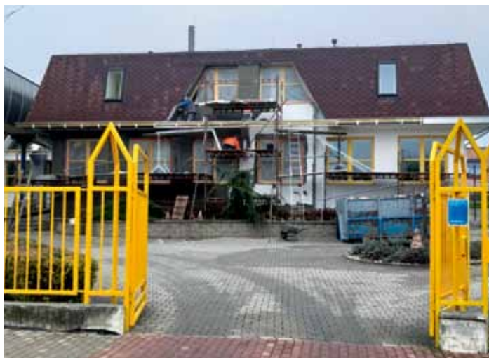
Pokračující práce firmy ZETA Benátky s.r.o. na opravě fasády sportovní haly - listopad 2024