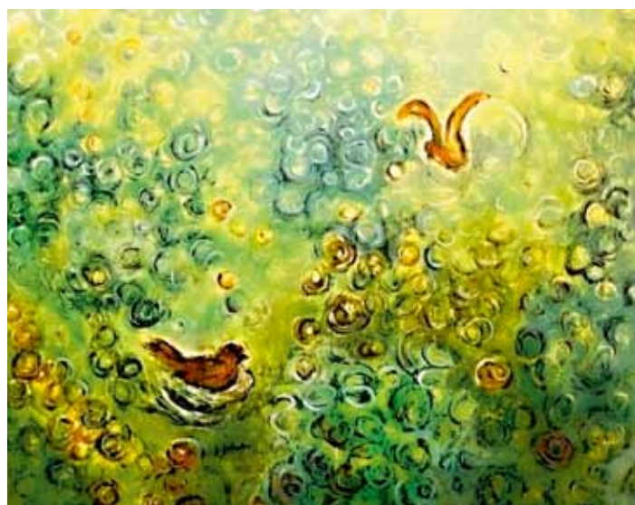
Josef Jakubec, olejomalba s názvem Hnízdění