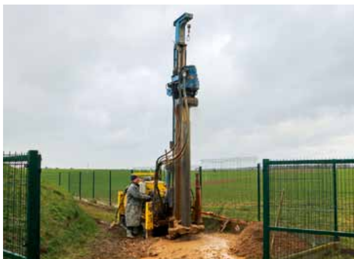
U vodojemu v H. Bousově probíhá zkušební vrt pro případné zálohování stávajícího vrtu ve Střehomí