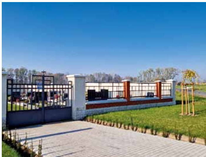
Bečov - úprava prostřanství před hřbitovem