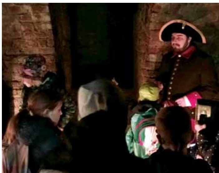
Přírodovědný kroužek na výletě ve vojenské pevnosti Josefov