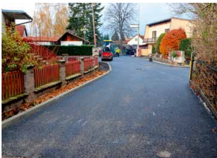
Ulice Na Koutě má nový asfaltový povrch. V přípravě je pokládka chodníků - listopad 2024