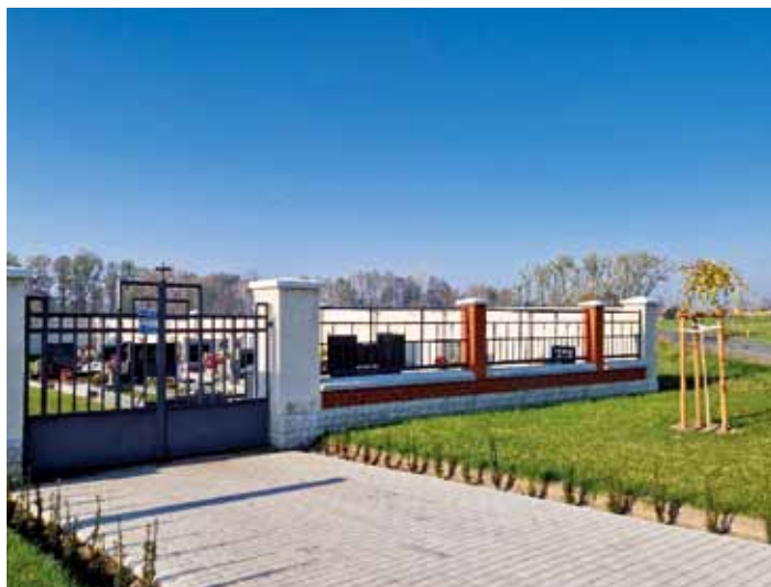
Bechov - úprava prostřanství před hřbitovem