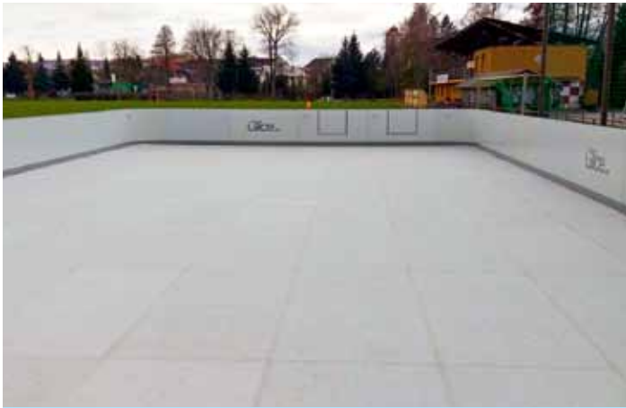
Ekologická bruslařská plocha 10x20 m švýcarské technologie GLICE