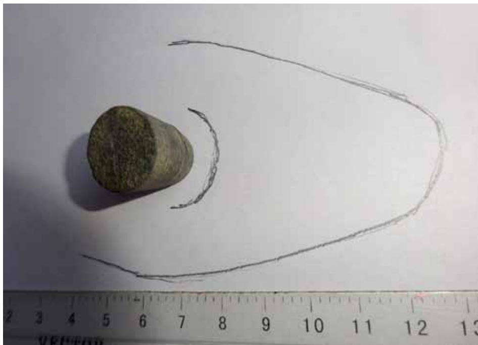
Kamenný vývrtek z Dolního Bousova

Před krátkým časem se nám podařilo najít právě takový kamenný „špunt“ z pro-