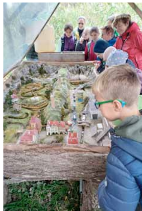
Nad modelem napřimené a přirozeně meandrující řeky

Další zastávkou byla záchraná stanice pro volně žijící živočichy v Jaroměři. Tady nám průvodkyně vyprávěla, proč se sem zvířata dostávají. Nejčastěji je na vině člověk. Srážka s autem, úraz elektrickým proudem (velcí ptáci jako jsou dravci nebo čápi roztáhnou křídla, propojí vodiče a způsobí si úraz nebo smrt), rybářské háčky a vlasce, plasty v přírodě, zábavní pyrotechnika, sekačky... to jsou hlavní příčiny pobytu zvířat v záchrané stanici. Čas od času jsou přijímána i ohočená divoká zvířata, například racci, čápi, havrani nebo dravci, kteří byli od vejce vychováni člověkem, jsou krotcí a neumí v přírodě žít. Například čáp Steve. To volala do ZS paní učitelka, že byla s žáky