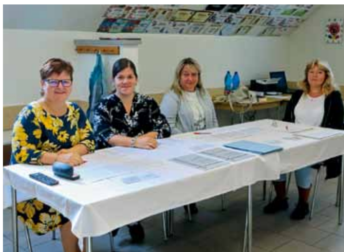
Volby do zastupitelstev krajů a do Senátu PČR 20. a 21. září 2024 - volební okrsek Horní Bousov