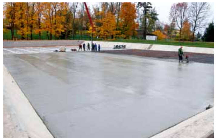
Betonování dna koupaliště firmou VLAFFLOOR s.r.o. Liberec - říjen 2024