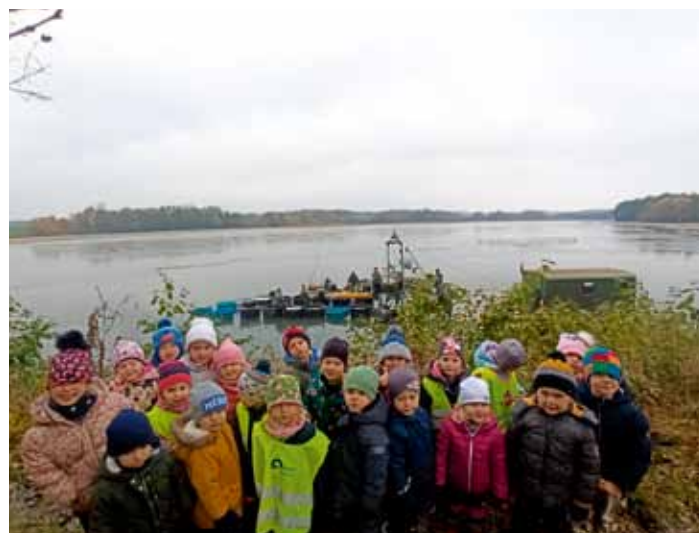
MŠ Kořata na výlovu Červenského rybníka