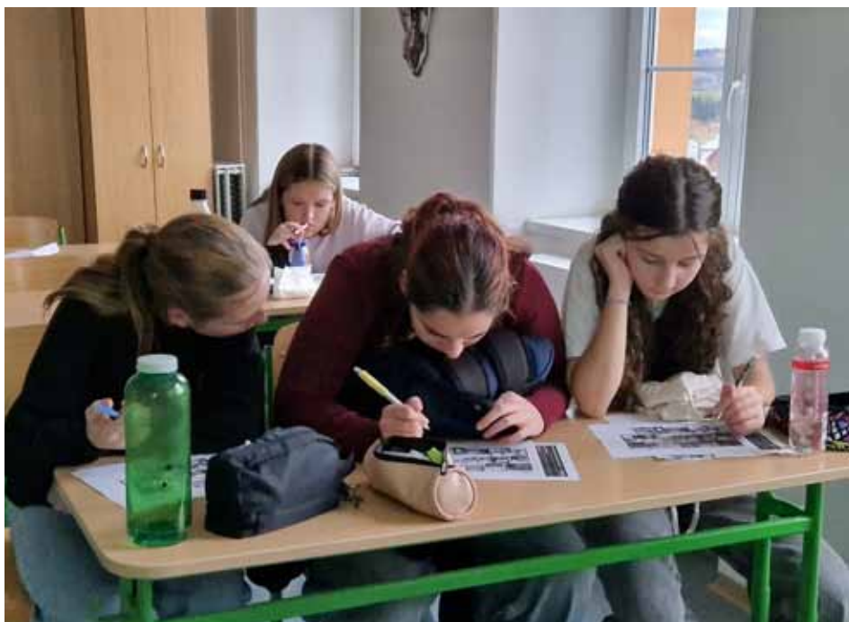
Práce s fotomiksem po promítání

Letošním tématem je 35. výročí sametové revoluce. V naší škole už je tradicí, že jsme promítání dokumentárních filmů pojali jako celodenní projekt. V úvodu se žáci rozpomínají na významné časové mezníky našich dějin, poté pracujeme s pojmy jako demokracie, totalita, bezpráví... K pochopení problému využíváme i krátké dokumentární filmy z pořadu Slavné dny internetové televize Stream.cz. Po ujasnění faktů jsme si pustili dokument Olgy Sommerové a Petra Nikolaeva Ztracená duše národa. Část nazvaná Ztráta slušnosti je výpovědí žen, které byly nesmyslně vězněny (a týrány!), a přesto je nic nezlomilo, ani v jejich víře, ani v životě. Dojemné příběhy lidské zástě, nenávisti, surovosti a nespravedlnosti děti velmi zasáhly. Někteří žáci byli ochotni mluvit o svých pocitech a neskrývali své pobouření. Podobně tomu bylo i v dokumentu Heleny Třeštíkové Hitler, Stalin a já, v němž paní Heda Blochová vzpomíná na léta strávená v koncentračním táboře v Osvětimi, na situaci po válce a po roce 1948, na odsouzení jejího manžela Rudolfa Margolia ve vykonstruovaném procesu v roce 1952 a jeho následné popravě či na emigraci v roce 1968. Tento dokument ukazuje na životním příběhu paní Blochové zřídmost obou systémů – nacismu i komunismu. Posledním