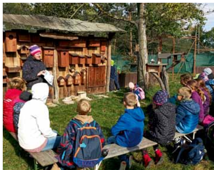
Přírodovědný kroužek na záchranné stanici v Jaroměři