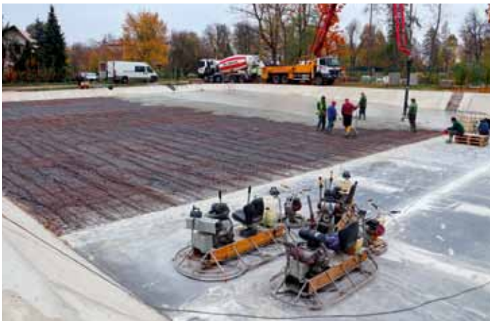
Betonování dna koupaliště 23. a 29. říjen 2024