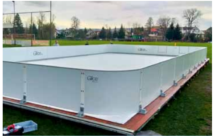
V areálu fotbalového stadionu je od prosince v provozu umělé Eko kluziště GLICE