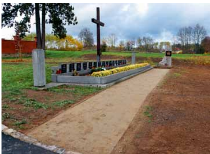
Pomníky padlých z 1. a 2. světové války mají nové mlatové chodníčky - realizovala firma Berounský Facility & Garden Servis - listopad 2024