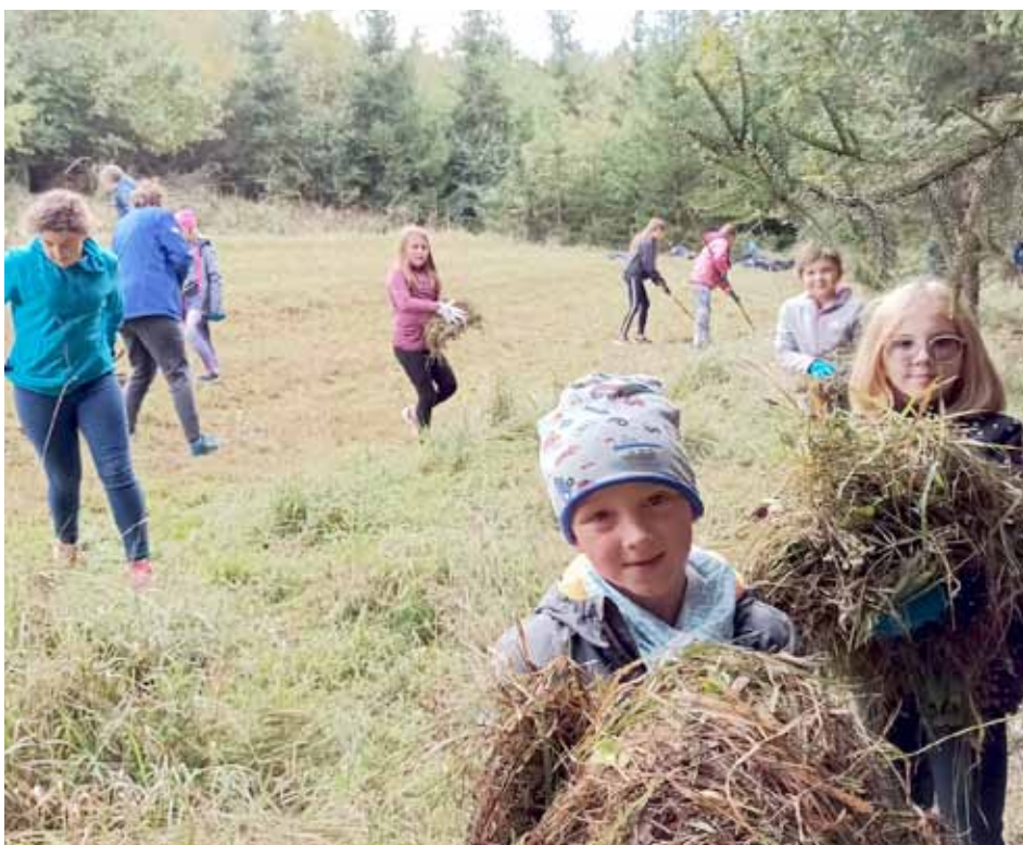
Podzimní práce na Hořečkové louce 2024