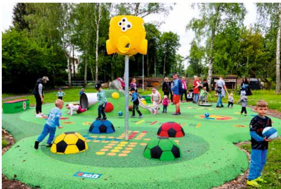
V areálu fotbal. stadionu vyrostlo nové dětské hřiště pro děti od 2 do 10 let - květen 2024