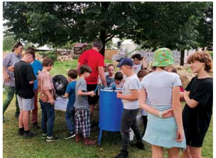
Přírodovědný kroužek při vytáčení medu z městských úlů na zahradě knihovny