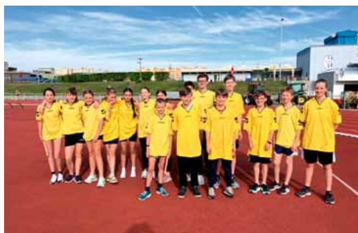
Žáci ZŠ na Poháru rozhlasu