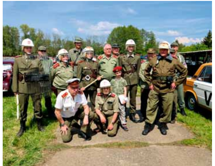
Vojenský den - květen 2024