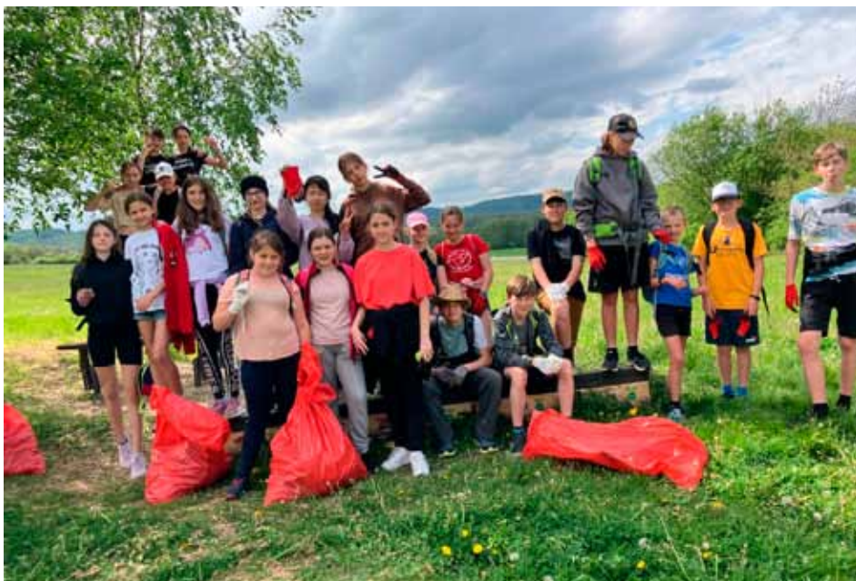
Den Země – žáci ZŠ mimo jiné vysbírali odpadky z okolí Bousova

Den Země. Dne 3. 5. 2024 proběhl tradiční Den Země. Žáci z druhého stupně naší základní školy byli rozděleni do několika skupin. Během dopoledne se jim podařilo uklidit hřiště s umělou trávou, shrabat