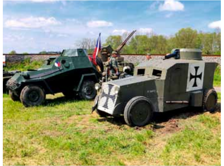
Vojenský den - květen 2024