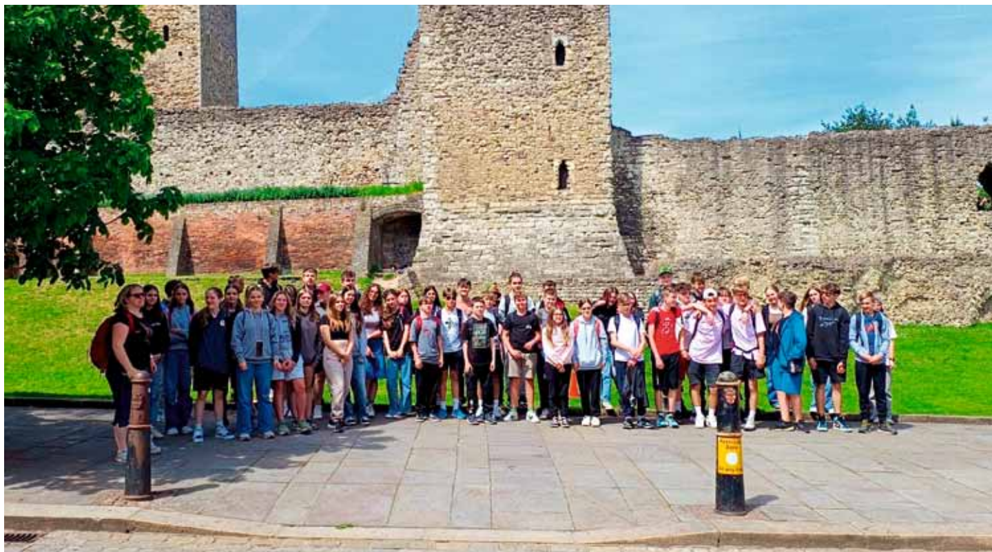
V termínu 6. - 12. 5. 2024 se žáci 7. a 8. ročníků vydali na sedmidenní pobyt do Anglie