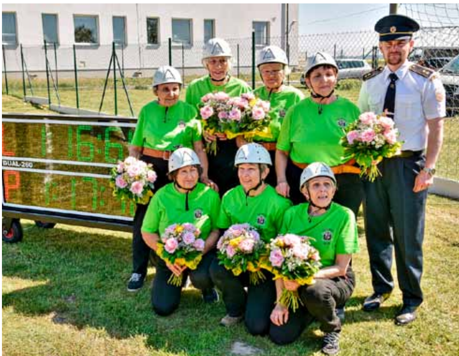
Rekordmanky SDH Obruby

Největší úspěch ale sklidilo družstvo žen z Obrub, které se dalo u příležitosti 100. výročí založení opět dohromady. Naše hasičky provedly požární útok v téměř stejné sestavě, jako když cvičily za náš sbor před 40 lety. Přípravě na to, aby vše zvládly, věnovaly 3 tréninky. A z původní plánované ukázky „staré gardy žen“ bylo nakonec zapojení do soutěže, aby děvčata z Bechova neměla vítězství bez boje. Překvapením pro obrubské družstvo žen bylo to, když se dozvěděly, že na soutěž byl pozván zástupce Agentury Dobrý den z Pel-