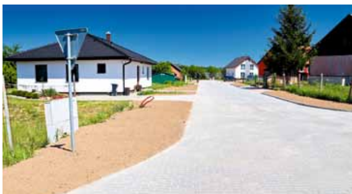
Nová místní komunikace v lokalitě Zahradka je dokončena - březen - květen 2024