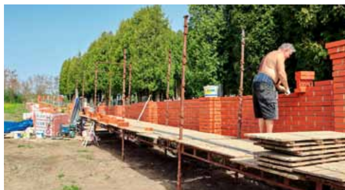
V březnu začala výstavba poslední západní hřbitovní zdi v D. B. - 4. etapa