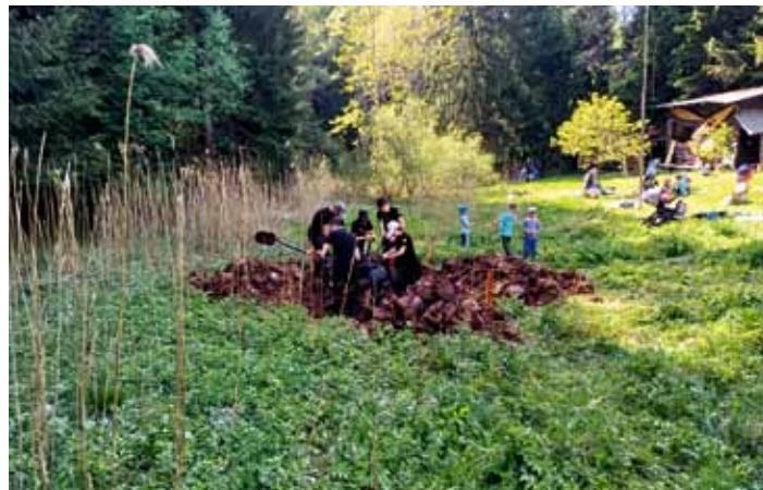
Přírodovědný kroužek se zúčastnil krajského kola soutěže Zlatý list, které proběhlo v sobotu 4. 5. v tábořišti v Borovnici u Staré Paky.