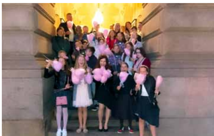
Žáci ZŠ před Národním divadlem