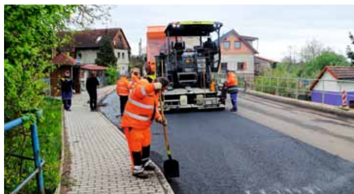
Horní Bousov - od 15. 4. 2024 má krajská komunikace od bývalé hospody po autob. zastávku, nový povrch