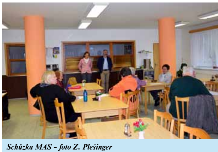
Schůzka MAS