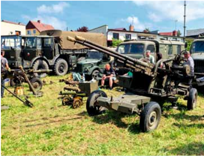
Vojenský den - květen 2024