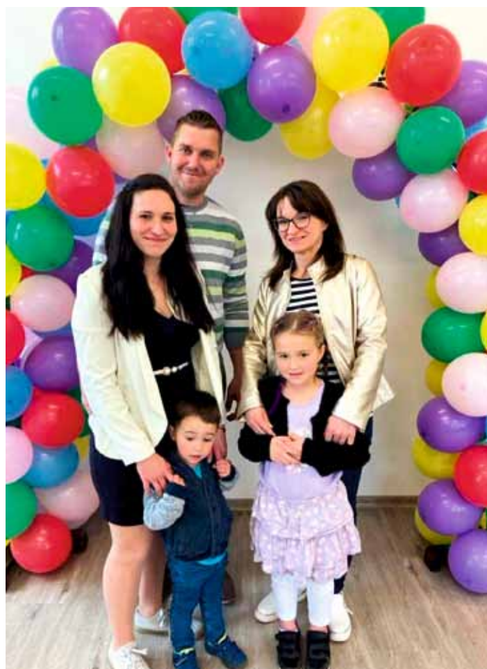
Památka na zápis do ZŠ pro celou rodinu