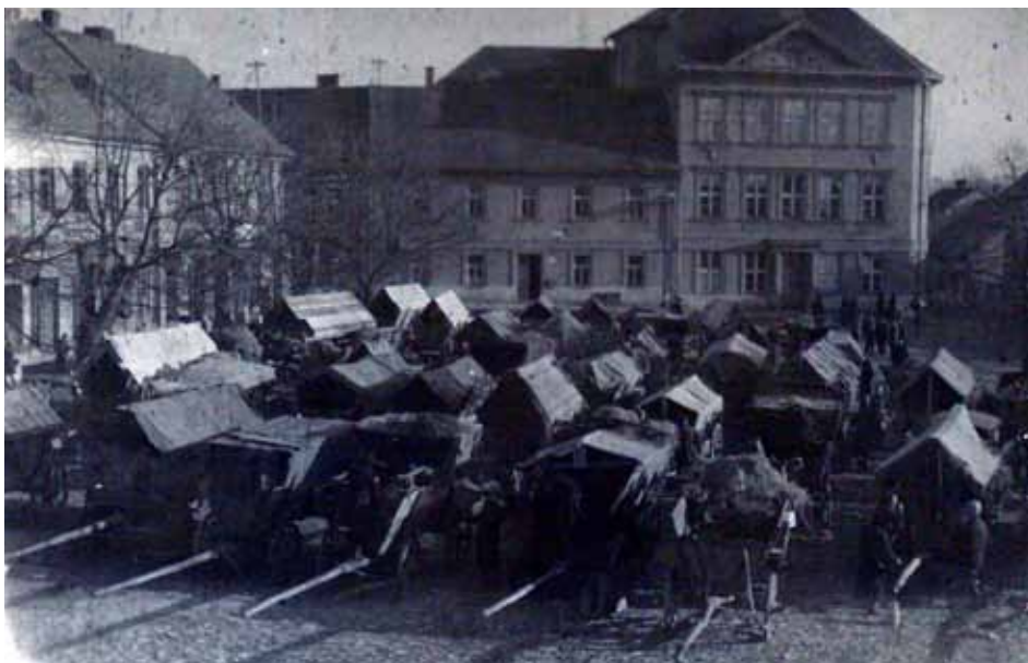
Rok 1945 - vozy „Národních hostů“ na náměstí v Dolním Bousově