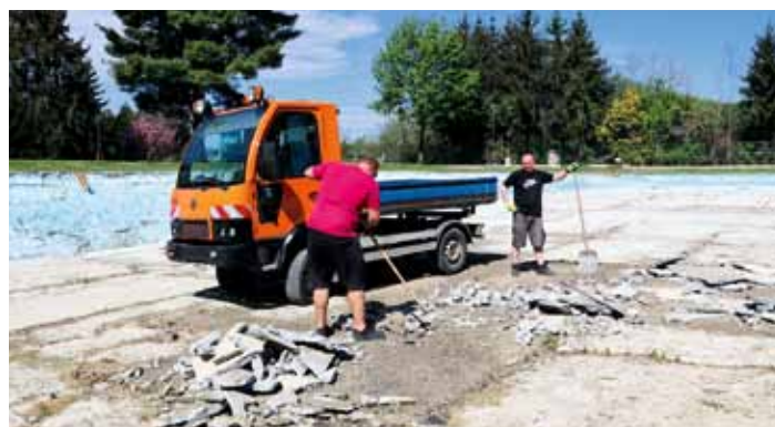
Začala oprava dna městského koupaliště - duben 2024