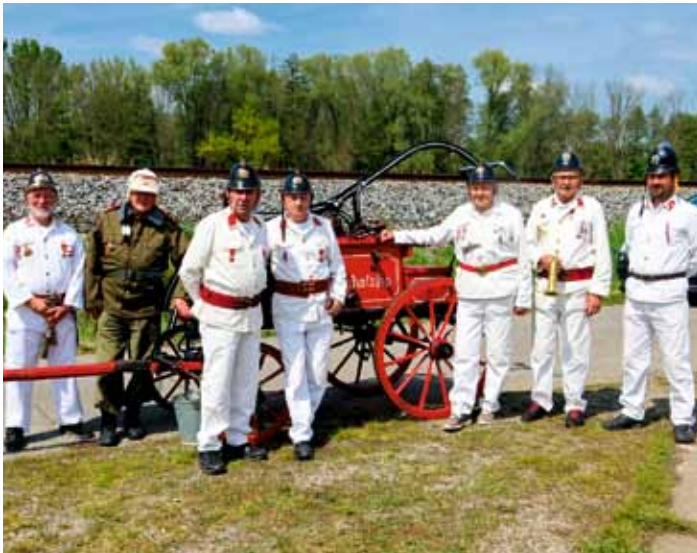
Vojenský den - květen 2024