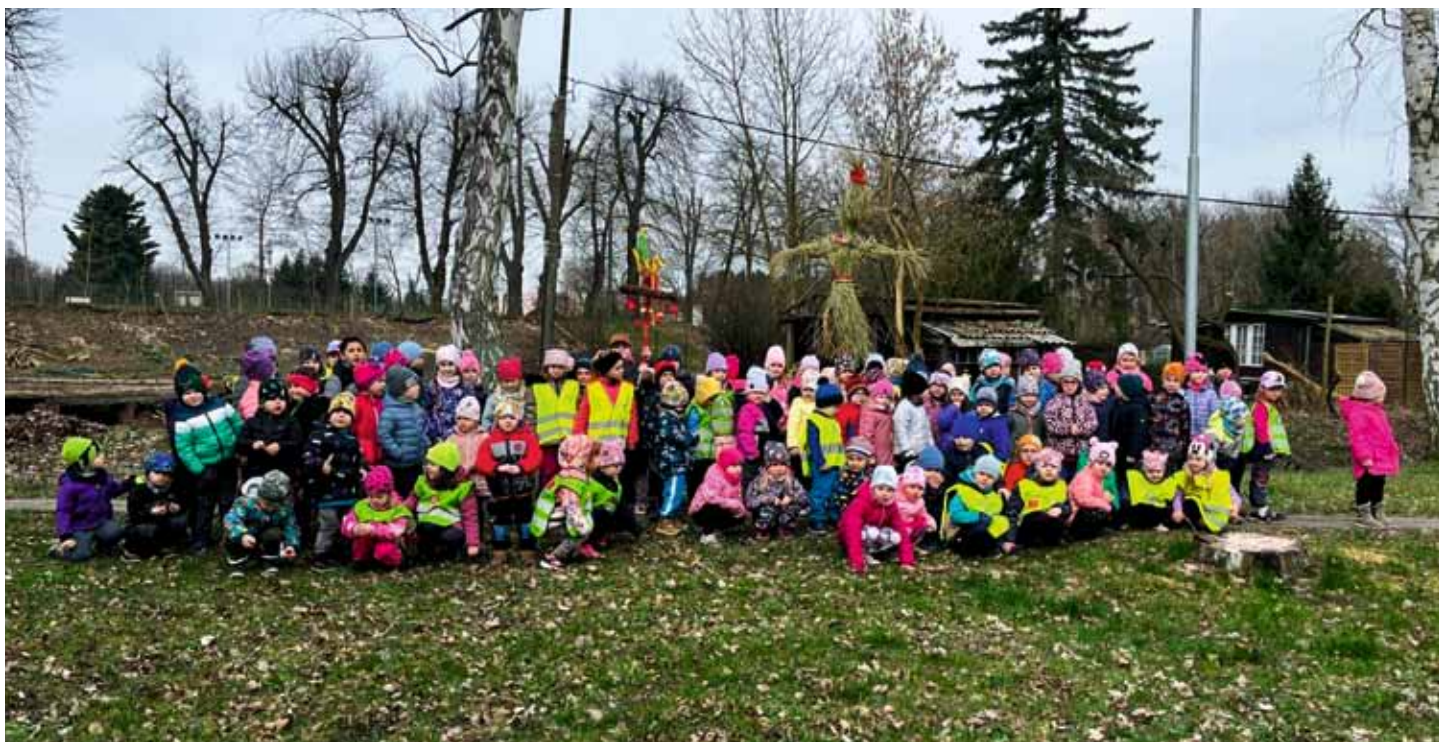
Ve čtvrtek 14. 3. se celá školka vydala průvodem včele s Moranou, rozloučit se s kralující Paní zimou