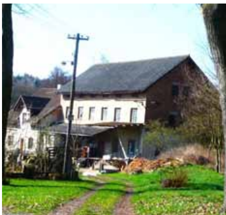
Bechovský mlýn sloužil v 50. letech už jen jako sklad krmiva Státního statku

10. ledna 1954 byly vládou vydány návrhy o národních výborech. K tomuto tématu byla na Bechově svolána 10. února schůze občanů. O čem přesně se disku-