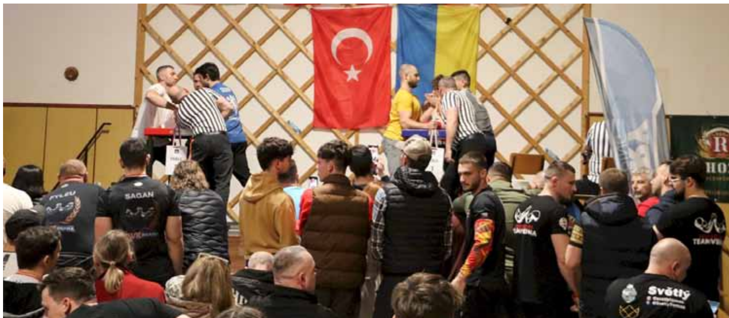
Mezinár.soutěž v armwrestlingu – Golemova ruka – 23. 3. 2024 sokolovna D.B.