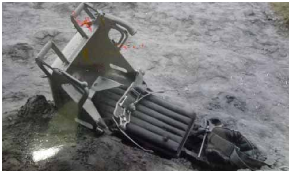
Sedadlo z letounu por. Plecítého