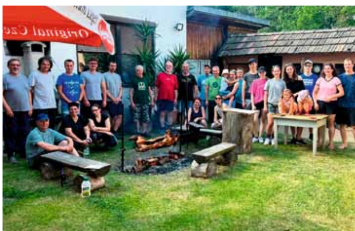
Stolní tenisté se po odehrané sezóně pravidelně setkávají, aby ji náležitě zhodnotili