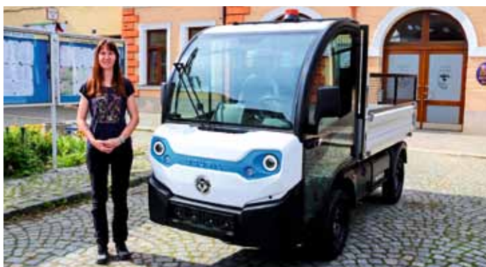
Elektrický užitkový vůz GOUPIL - G4, pro potřeby městské zahrádky - květen 2024