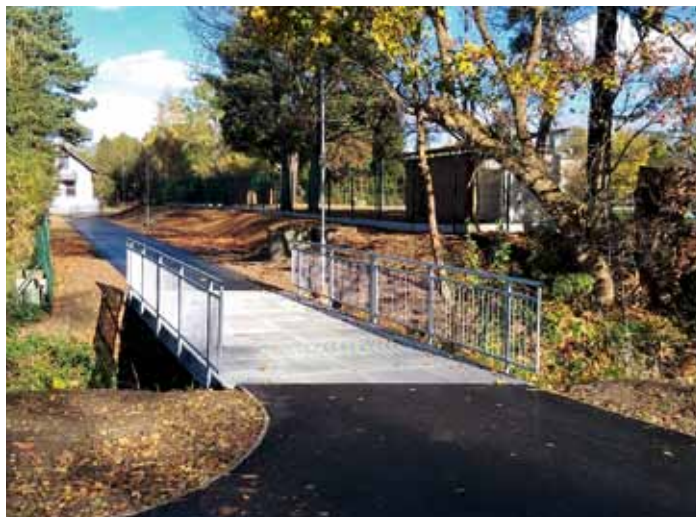
In-line dráha v areálu Na Školništi je téměř hotova