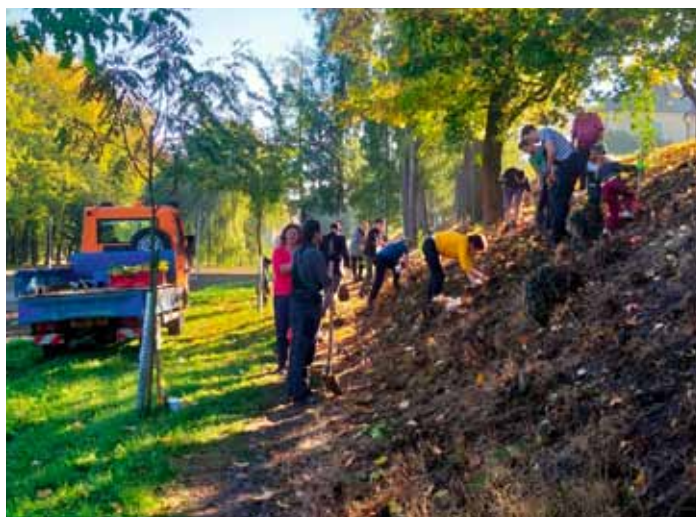
V sobotu 21. 10. proběhla výsadba stromků a keřů Na Školništi v Dolním Bousově