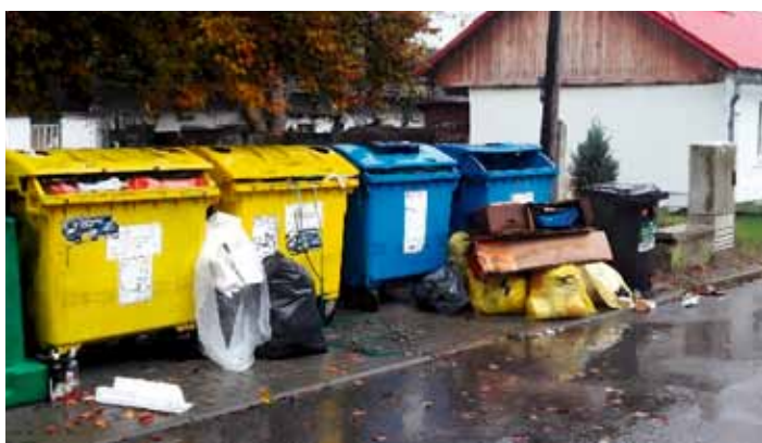
Neutěšený stav odpadů na sběrném místě V Kališti