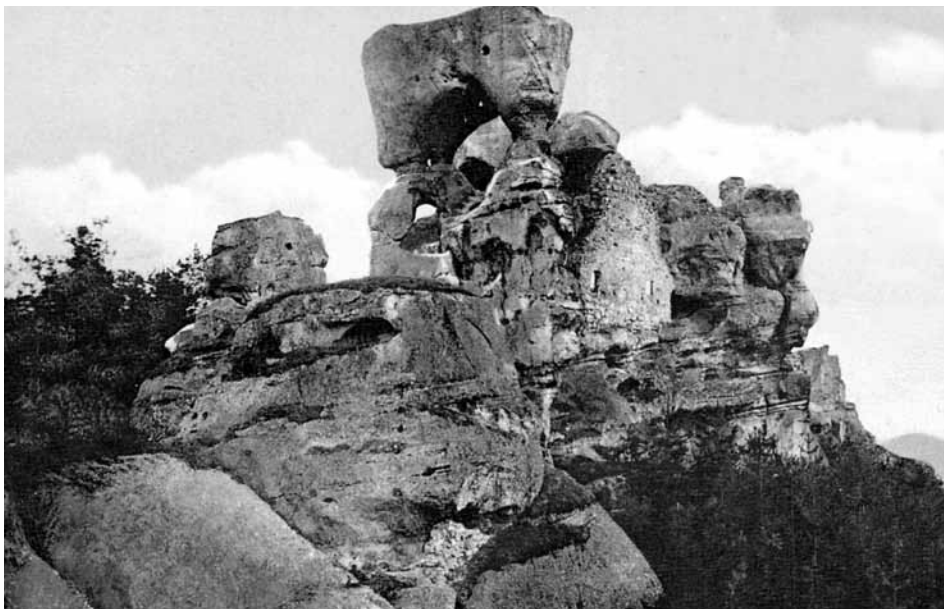
Dnes zbyla po slavném sídle Voka z Rotštejna jen pískovcová zřícenina

Toto starší osídlení se zde – v jižní oblasti Českého ráje – z velké části zarazilo o pravý břeh řeky Klenice stékající k jihu. Na její levý břeh pak proniklo jen do bezprostředního okolí Sobotky, což dokládá nebývalá hustota kostelů – Libošovice, Nepřívěc, Osek, Sobotka, kdy prakticky z jednoho koukáme na druhý. Ve starším období (cca do poloviny 13. století) byly kostely na venkově zakládány jako součásti sídel (dvorců) velmožů, tedy rané šlechty. Díky