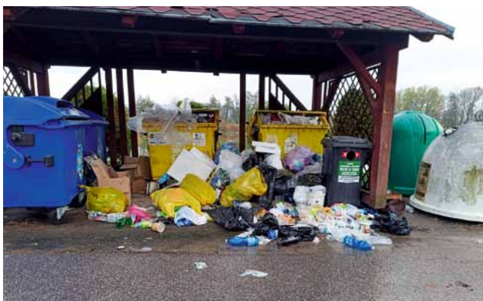
Takto vypadalo sběrné místo u rybníka Pískovák v polovině listopadu, přestože pytle s tříděným odpadem se zde smí odkládat pouze poslední víkend v měsíci a jen několik ulic odsud je v provozu sběrný dvůr.