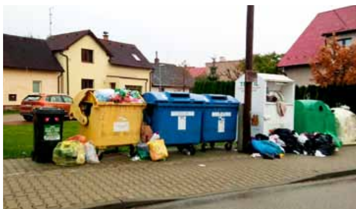
Ve stejný den také nepořádek po občanech v ulici Požárníků