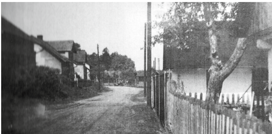
Svobodín, 50. léta