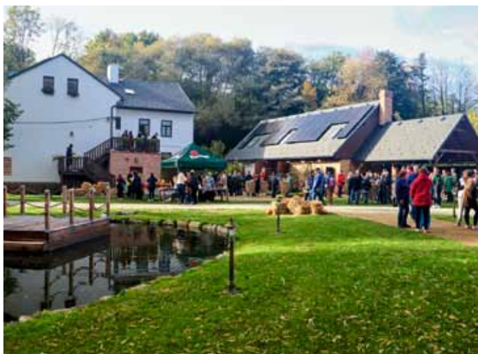
Sváteční akce na Buškovském mlýně 28. 10. 2023 U nás to klope!