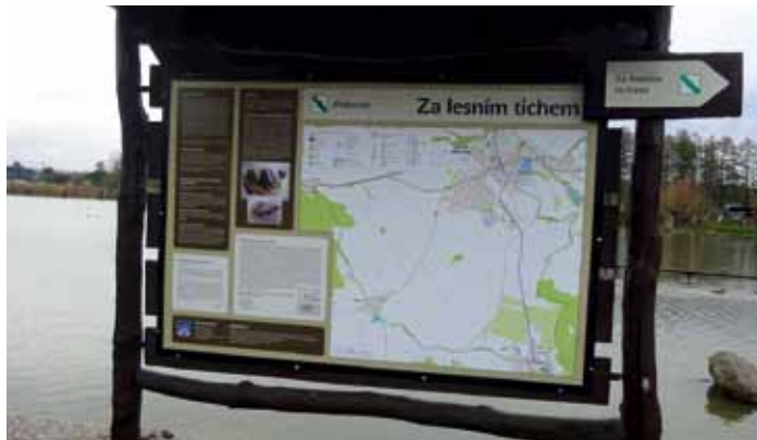
Tabule č. 1 nové naučné stezky, která začíná u rybníka Pískovák