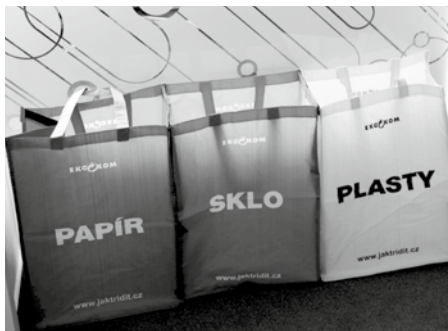
Tuto trojici tašek na třídění si může každý občan zdarma vyzvednout na MěÚ, sběrném dvoře a v IC.

Co vlastně znamená předcházet vzniku odpadů v domácnosti, proč je to důležité a hlavně, že to je docela snadné. Jedná se o téma, které se dotýká každého z nás, proto se mu věnují také zákonné normy