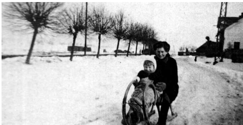
Svobodín, 50. léta

I nadále museli lidé plnit povinné dárky, stále byly přidělovány potravinové lístky. „Zdejší zemědělci až na nepatrné výjimky plnili dodávky svědomitě, třebaš ubylo pracovních sil následkem osídlení pohraničí. Z Bechova a Svobodína se odstěhovalo šest