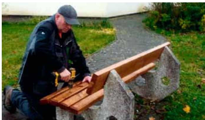
Lavičky u DPS budou zrenovovány pilou Borovička & syn