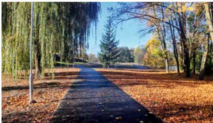
In-line dráze chybí jen dokončení osvětlení a zasetí trávy