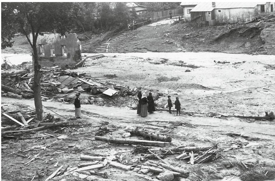
Před 100 lety si protřžená přehrada v Jizerských horách během chvíle vyžádala 65 životů.