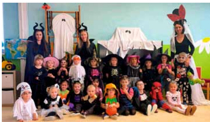
Haloween v MŠ ve třídě u Berušek