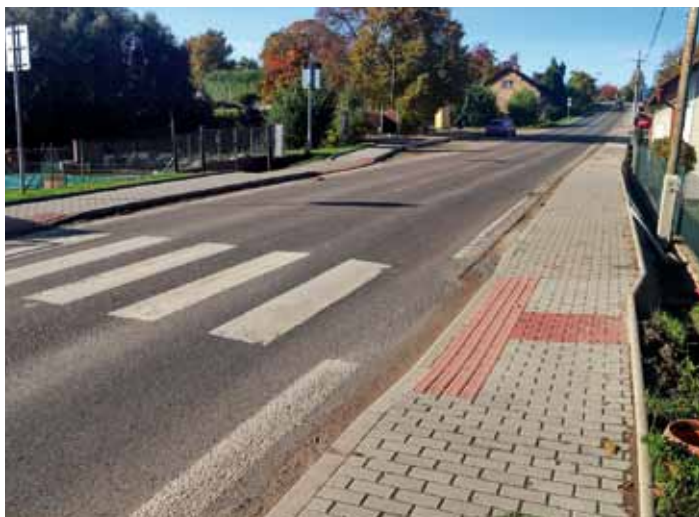
Horní Bousov - v říjnu 2023 byla dokončena výstavba nových chodníků II. etapy