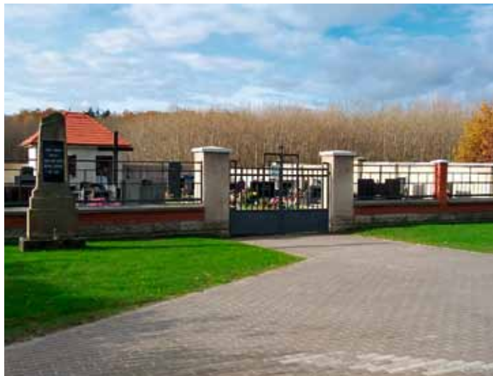
Bechov - oprava hřbitovní zdi a márnice je ve finále. Listopad 2023.