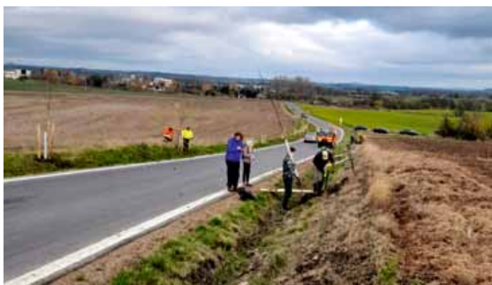
Směrem na Vlčí Pole bylo z grantu ŠKODA vysazeno 74 stromů