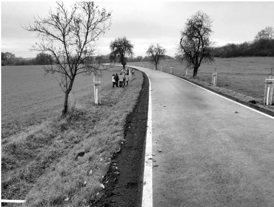
Za asistence pracovníků technických služeb města proběhla výsadba stromořadí podél silnice na Rachvalách dobrovolníky – zaměstnanci společnosti O2.

Na začátku tohoto projektu byl ode mě typ na možnou výsadbu pro občanský spolek ČSOP Klenice. Z typu na výsadbu nám spolupráce přerostla na technickou i praktickou podporu města, a to určením hranic pozemků společně se Správou a údržbou silnic Středočeského kraje, následně jsme se zaměstnanci města vyměřili místa pro jednotlivé stromy, převzali výsadbu a materiál potřebný k oplocení (materiál a sadbu si občanský spolek zařídil sám), rozvezli jsme zajištěný materiál a stromy k výsadbě, pro dobrovolníky jsem řekla odborný výklad o správném provedení výsadby a následně jsem zajišťovala odborný dozor. Dobrovolníky mělo ČSOP Klenice