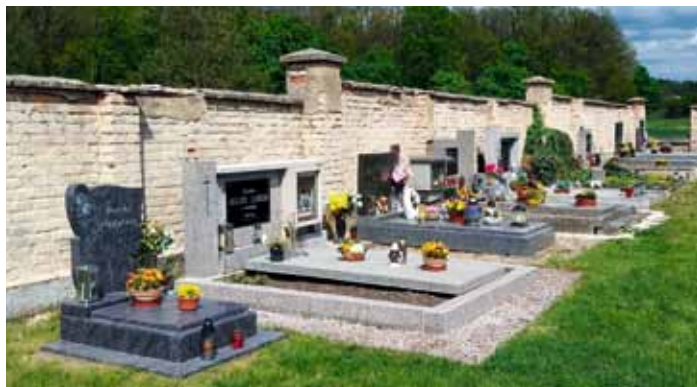
Bechov - další investiční akcí je oprava hřbitovní zdi a revitalizace okolí hřbitova - duben 2023