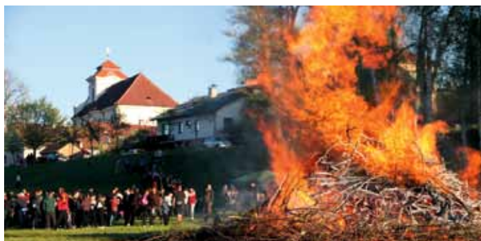
Tradičně 30. dubna 2023 proběhlo pálení čarodějnic Na Školništi v Dolním Bousově