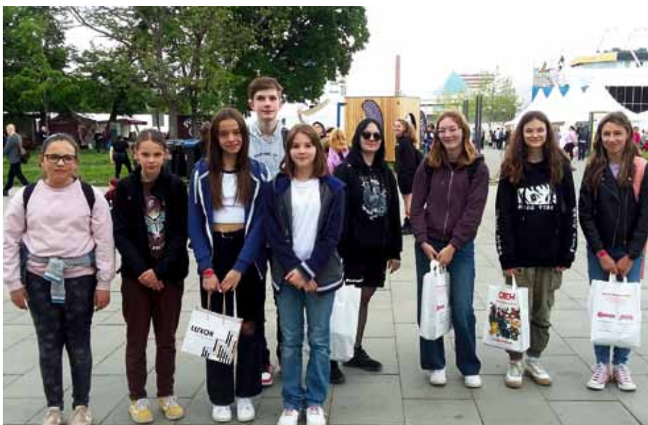
Žáci z dolnobousovského čtenářského klubu na knižním veletrhu Svět knihy v Praze.