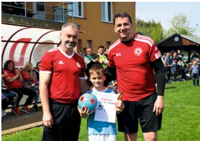
20. ročník fotbalového turnaje starších přípravků pod záštitou starosty města se konal 1. 5. 2023.