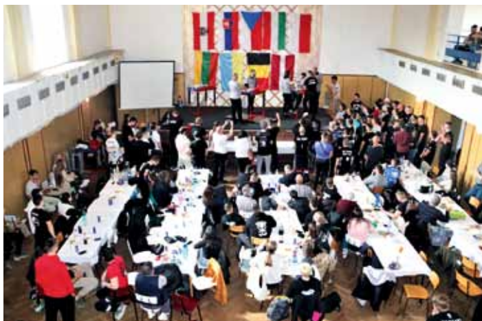
25. března 2023 se v místní sokolovně uskutečnila armwrestlingová soutěž Golemova ruka