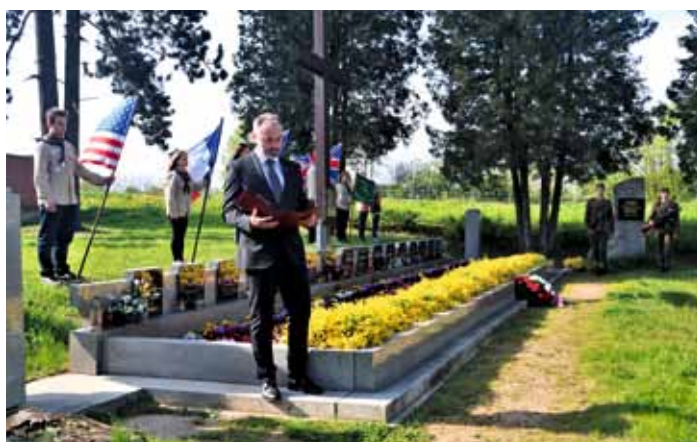
Pietní akt u Pomníku padlých 7. květen 2023 Dolní Bousov