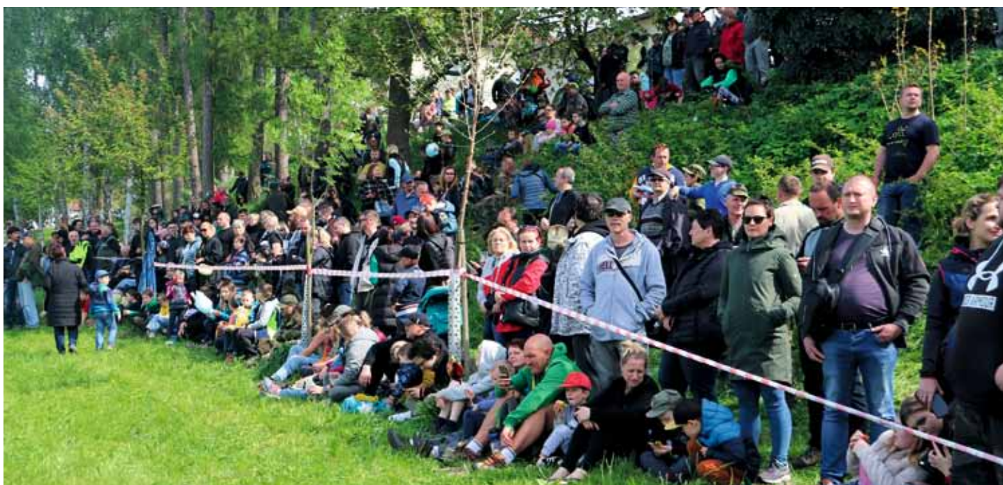
Vojenský den Na Školniště přitáhl nejenom děti