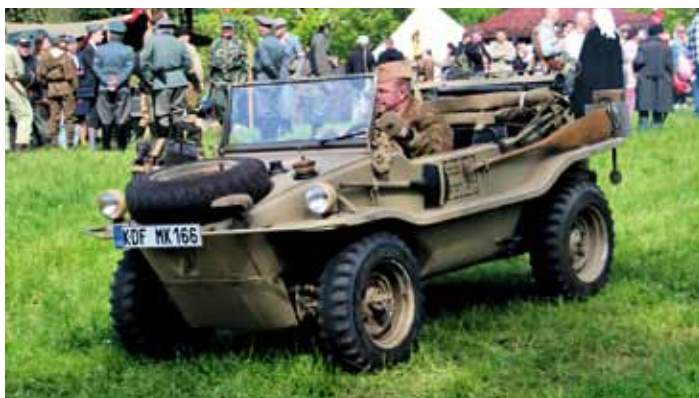
Vojenský den Na Školništi - 7. květen 2023