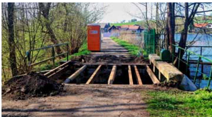
Střehom - v dubnu začala rekonstrukce mostu přes Klenici