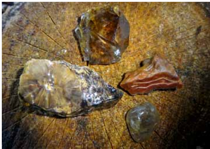
Po dešti lze v okolí DB nasbírat krásné minerály - acháty, záhnedky, křišťály i araukarit.