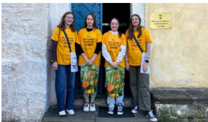
Vě středu 10. května vybíraly dobrovolnice z 9. třídy peníze pro celorepublikovou sbírku Liga proti rakovině. Děkujeme.