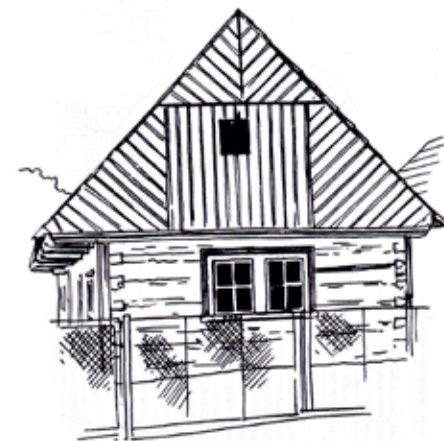
Svobodín - Roubený dům čp. 2 z konce 18. či začátku 19. století s dvoupásovou skládanou lomenicí.