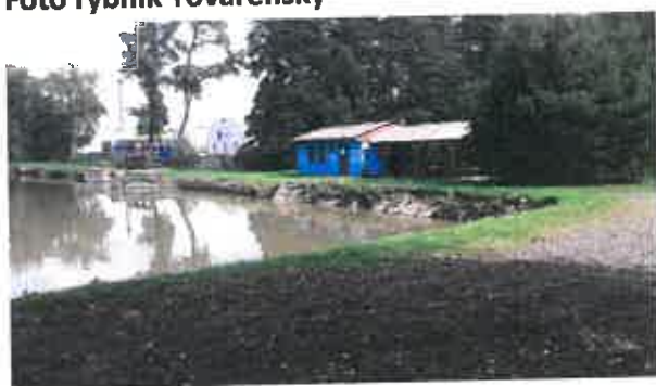
Foto rybník Továrenský

Další spolky, které se věnují mládeži, jsou Sbory dobrovolných hasičů Dolní Bousov, Bechov – Svobodín a Horní Bousov . Sbory dobrovolných hasičů vedou dětské oddíly požárnímu sportu, ve kterých se děti učí samostatnosti a trénují tělesnou zdatnost. SDH se pravidelně zúčastňují pravidelných soutěží v požárním sportu. Sbory sami pořádají soutěže ve svých místních částech. Zapojují se do organizace akcí pořádaných ve městě a příslušných místních částech.