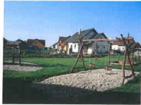
Dětské hřiště v prostoru „na fotbalovém stadiónu“.

Na dětském hřišti byla umístěna tato zařízení: