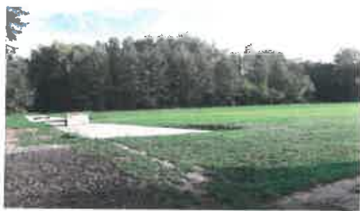
Foto: hasičský areál Svobodín