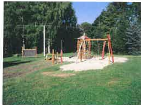
Dětské hřiště v prostoru lokality „Zahrádky“.

Na dětském hřišti byla umístěna tato zařízení: